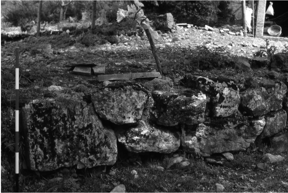
Fig. 4. Loc. Cuccio, muro in opera poligonale (AVT 13).

di Citerna, ugualmente connotato da una cinta muraria a secco realizzata con blocchi lapidei di dimensioni diverse.