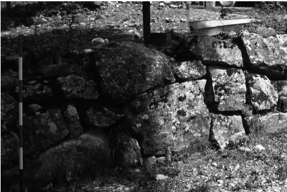
Fig. 3. Loc. Cuccio, muro in opera poligonale (AVT 13).