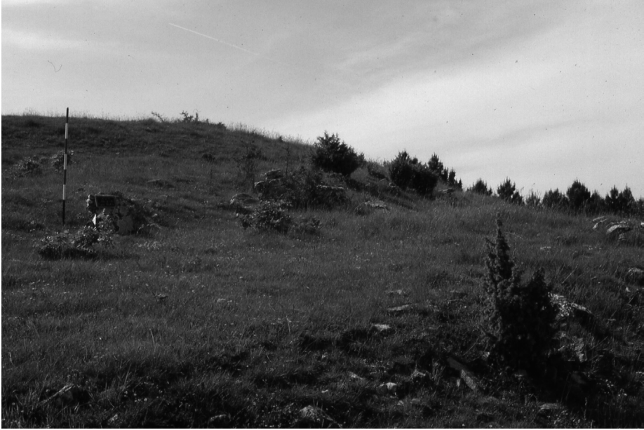
Fig. 2. Poggio Rota, cinta perimetrale (AVT 37).