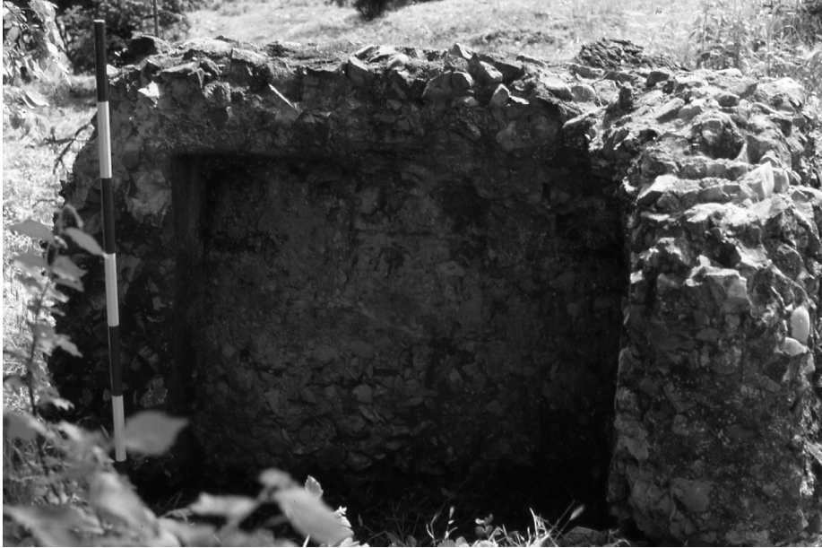
Fig. 5. Loc. Bagnolo, cisterna in opera cementizia (AVT 20).

nelle località di Userna (A.V.T. 3) e Serrone (A.V.T. 46) dovevano trovarsi due ville di tipo residenziale. In loc. Felceto (A.V.T. 30) la presenza di una fornace, oltre ad essere stata ipotizzata sulla base di notizie orali, è stata supportata dal rinvenimento, cospicuo, di frammenti pertinenti quasi esclusivamente ad un tipo anforico capillarmente diffuso nell'ambito territoriale oggetto della ricerca ma non ascrivibile alle produzioni comunemente note. La produzione, che doveva essere evidentemente rivolta ad una clientela locale, può essere inquadrata tra il I ed il II sec. d.C., sulla base delle altre occorrenze recuperate sul sito stesso. Notevole importanza rivestono inoltre alcuni insediamenti ubicati in stretta contiguità con il Tevere: nelle località Tinacci (A.V.T. 25), Cinquemiglia (A.V.T. 50) e Giove (A.V.T. 70), sono stati infatti rinvenuti numerosi frammenti di anfore, alcune delle quali (di produzione spagnola e solitamente adibite al trasporto di garum ), fanno ipotizzare la presenza di scali sul fiume per lo stoccaggio delle merci. Nella stessa condizione topografica si trova il sito di Cerfone (A.V.T. 58), situato in corrispondenza di un'ansa del torrente omonimo, affluente del Tevere, a testimonianza del probabile sfruttamento a fini commerciali anche delle aste fluviali minori, il cui trait d'union doveva essere evidentemente rappresentato proprio dal Tevere, allora navigabile (Plin. ep. V 6, 11).