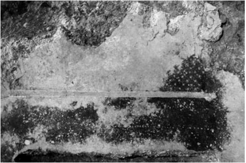
Fig. 5 – Pavimento di uno dei vani del tempio con punteggiatura a crocette.