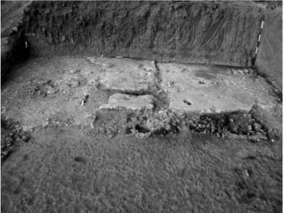
Fig. 7 – Pavimento in cocciopesto.