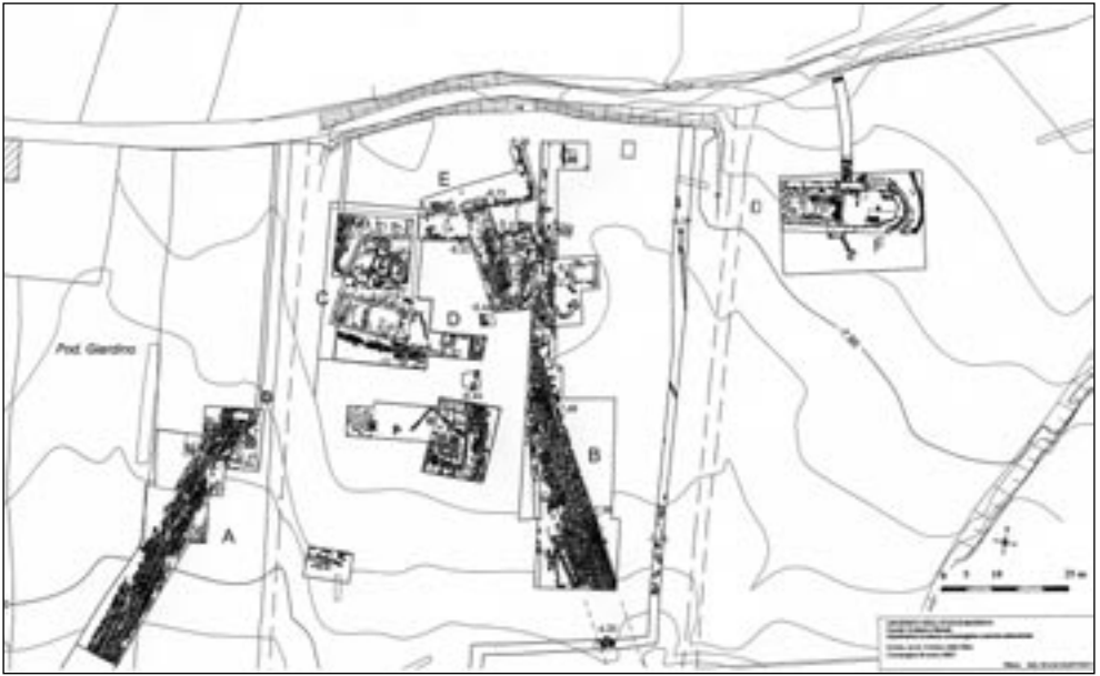
Fig. 1 – Orvieto, Campo della Fiera. Planimetria generale della porzione centrale dell'area di scavo (ril. Arch. Simone Moretti Gianì).