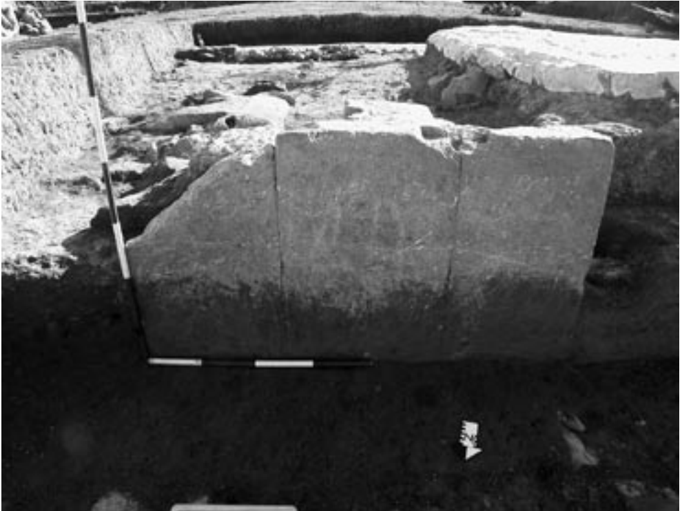
Fig. 2 – Lato NE del tempio, lastre di trachite.