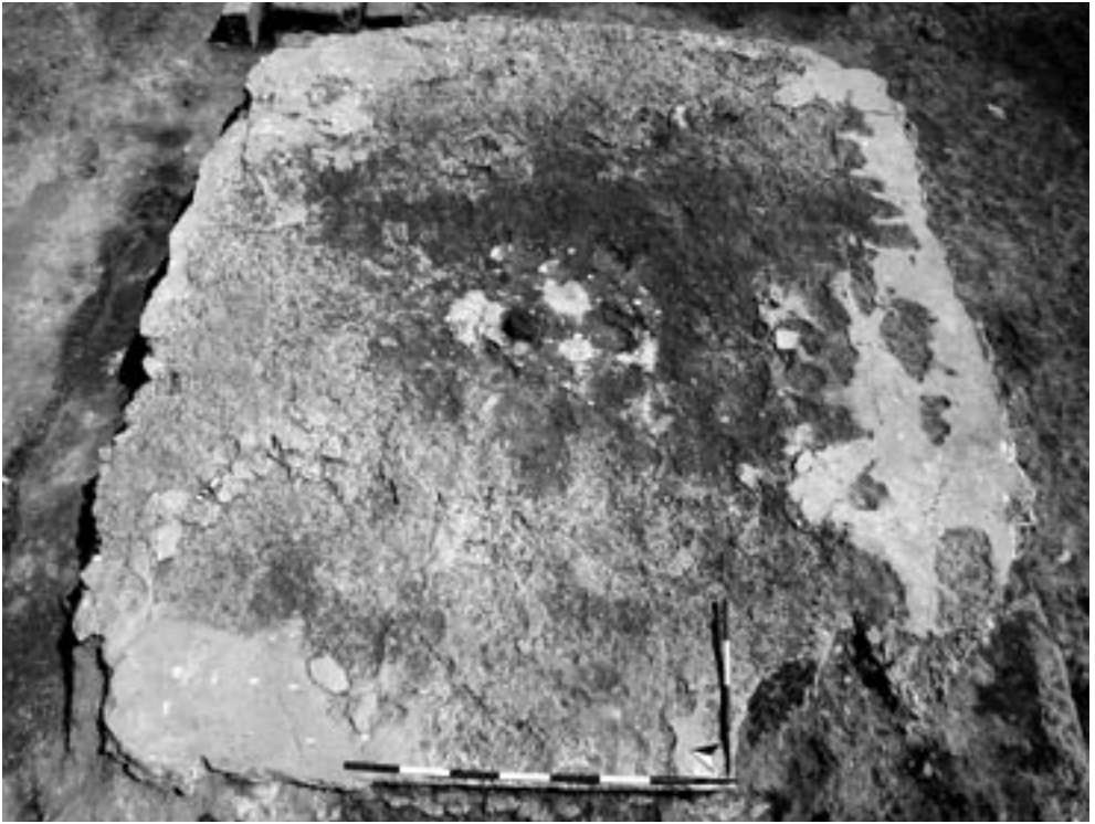
Fig. 3 – Pavimento di uno dei vani del tempio (foto Dip.to S.A.S.A, Univ. di Macerata).