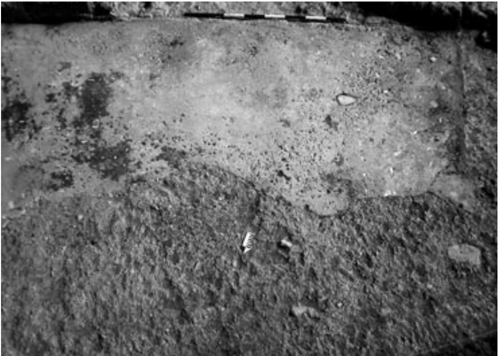
Fig. 6 – Pavimento in signino con inserzioni lapidee e punteggiatura a crocette (Foto Dip.to S.A.S.A, Univ. di Macerata).