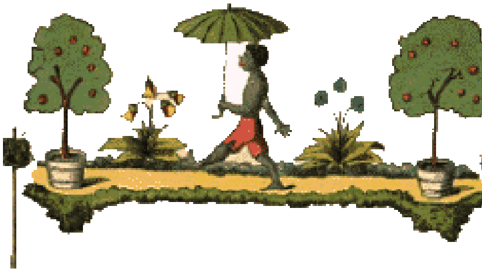
Abb. 3. Struwwelpeter (Frontispiz).