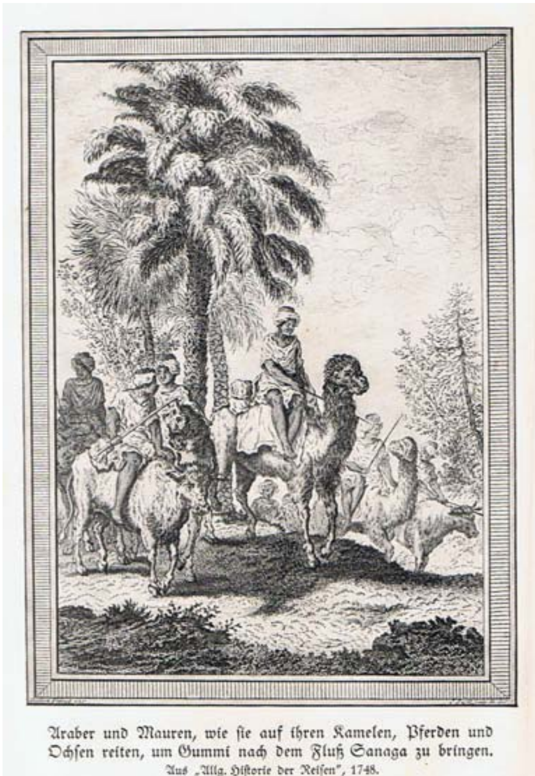
Abb. 2. "Araber und Mauren" in Mungo Park, Vom Gambia zum Niger , S. 16.