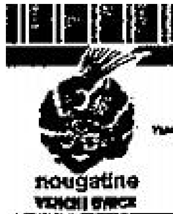
Abb. 5. Bonbon-Papier Nougatine Venchi.