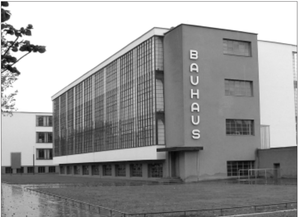
Sede del Bauhaus di Dessau (attiva dal 1923 al 1932).