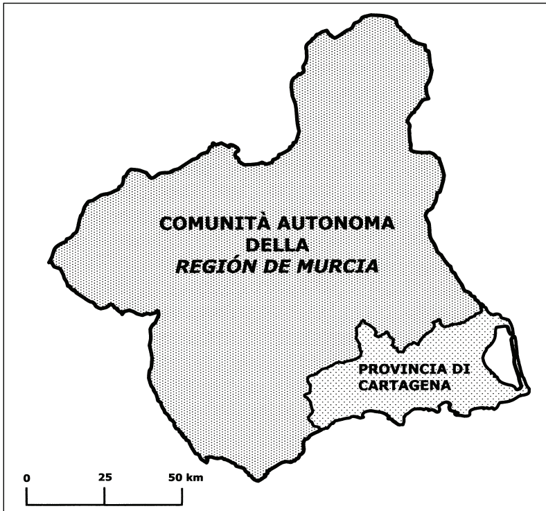
Fig. 2 - Territorio dell'ipotetica provincia di Cartagena all'interno della Comunità Autonoma di Murcia.

rebbe, secondo il meccanismo elettorale spagnolo, la presenza di due deputati e quattro senatori in più a livello di rappresentanza nel Parlamento nazionale (Calleja, 21/V/2006). Inoltre l'aspirazione di ottenere una maggiore quota di autonomia all'interno della Comunità stessa non è rimasta circoscritta alla sola richiesta di istituzione della provincia di Cartagena, poiché, negli ultimi anni si è fatta sempre più pressante la tendenza a creare nuove entità comunali, come nel caso degli insediamenti di El Agar, La Palma e La Manga (Rovati, 2001, pp. 23-38).