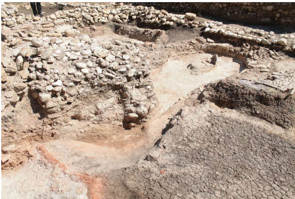
Fig. 2. Le fornaci repubblicane di Pollentia-Urbs Salvia .

meglio conservate. Due (fig. 2) sono affiancate con direzione nord/sud ed una terza (C), con direzione est/ovest, appartenente ad una diversa fase di vita del complesso 11 . Si tratta di strutture molto semplici, basate sul sistema del forno aperto del tipo Ib della Cuomo di Caprio 12 .