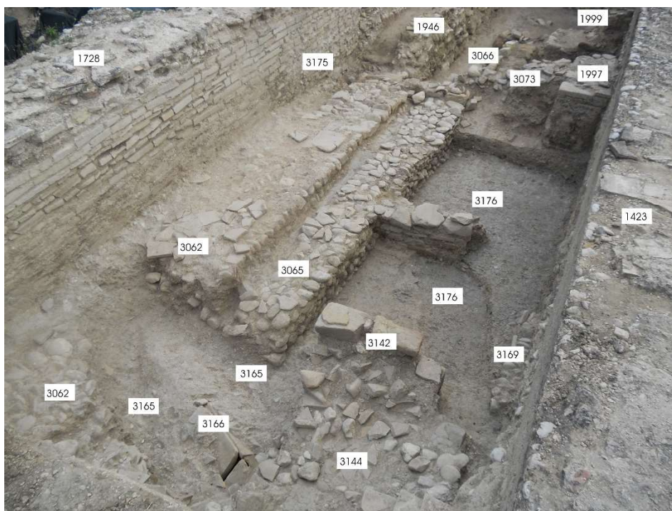
Fig. 7. Area a nord della forgia, livelli di frequentazione repubblicani.

Gli impianti produttivi della ceramica e del ferro, collocati a ca. 90 m di distanza l'uno dall'altro, fanno riferimento a un insediamento che in questa fase doveva estendersi ben oltre e che è stato individuato nell'area occupata dal successivo foro di età graccana.