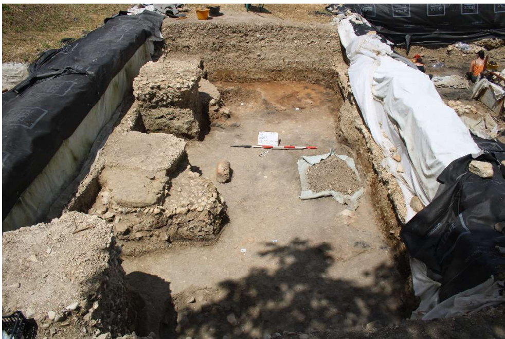
Fig. 5. L'Ambiente 2, tracce sullo sfondo di una forgia.