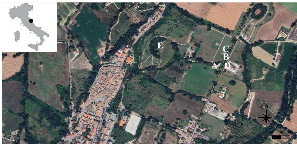
Fig. 1. Localizzazione dei contesti databili tra III e II sec. a.C., precedenti la colonia graccana a Pollentia-Urbs Salvia .

Le prime tracce dell'occupazione dell'area sono state individuate ai limiti sud-ovest del foro coloniale di età graccana (fig. 1A) e sono riferibili ad un complesso artigianale 10 del quale si conservano alcune fornaci, tre delle quali in particolare