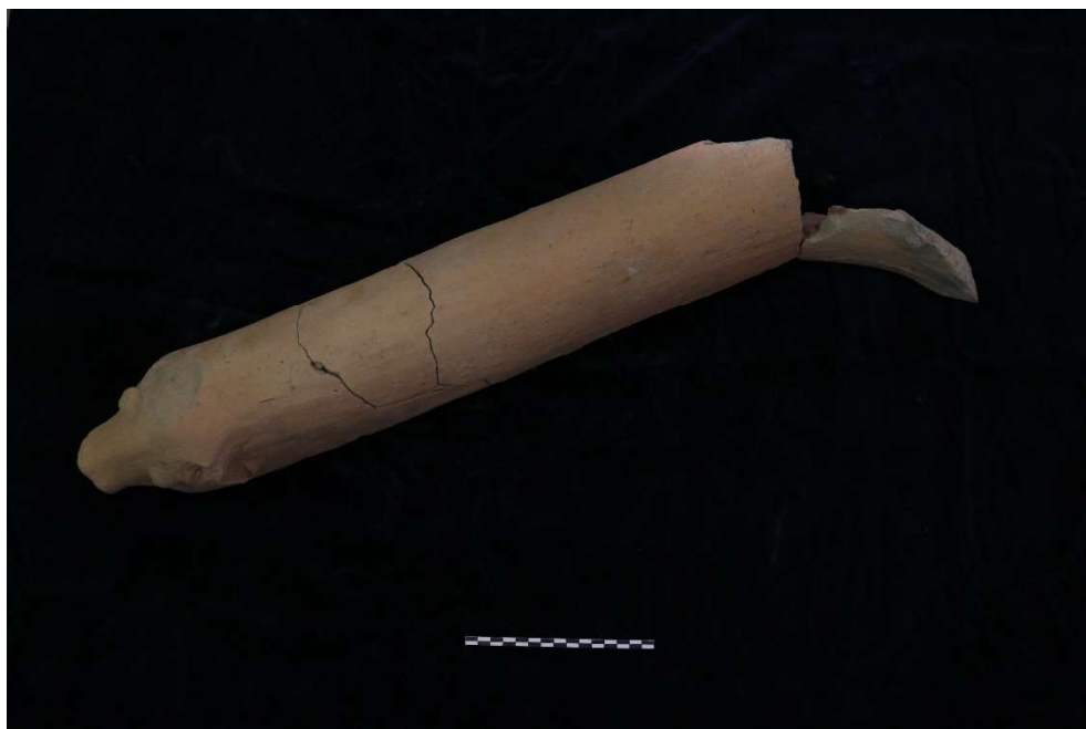
Fig. 6. Frammenti di mantice in terracotta da Pollentia-Urbs Salvia .

Tra gli indicatori di produzione, oltre a scorie di lavorazione del ferro, frammenti in argilla concotta e vetrificata, carboni e fondi di focolare, di particolare interesse è il ritrovamento (fig. 6) dei resti di un mantice in terracotta terminante a protome bovina, che trova pochi, ma significativi confronti, attualmente in fase di studio 15 .