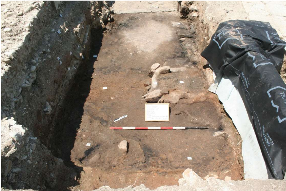
Fig. 4. La forgia repubblicana di Pollentia-Urbs Salvia .