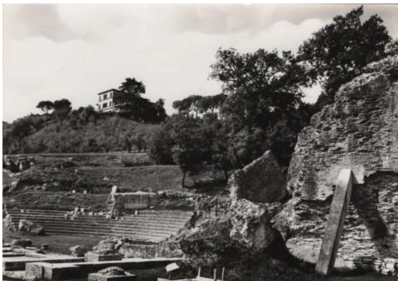
Fig. 8. Immagine degli anni '50 del teatro di Urbs Salvia , in primo piano struttura di età imperiale inglobata nella parte superiore del settore sud-ovest dell' ima

Il culto è stato attribuito alla Bona Dea , le cui valenze terapeutiche e salutifere derivano probabilmente direttamente alla Agathé Théos e dunque dalla Igea greca, con evidenti relazioni con sorgenti ed aree ricche d'acqua.