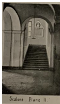
4) Riproduzione dello scalone lungo il quale è collocato l'omaggio a Langlois