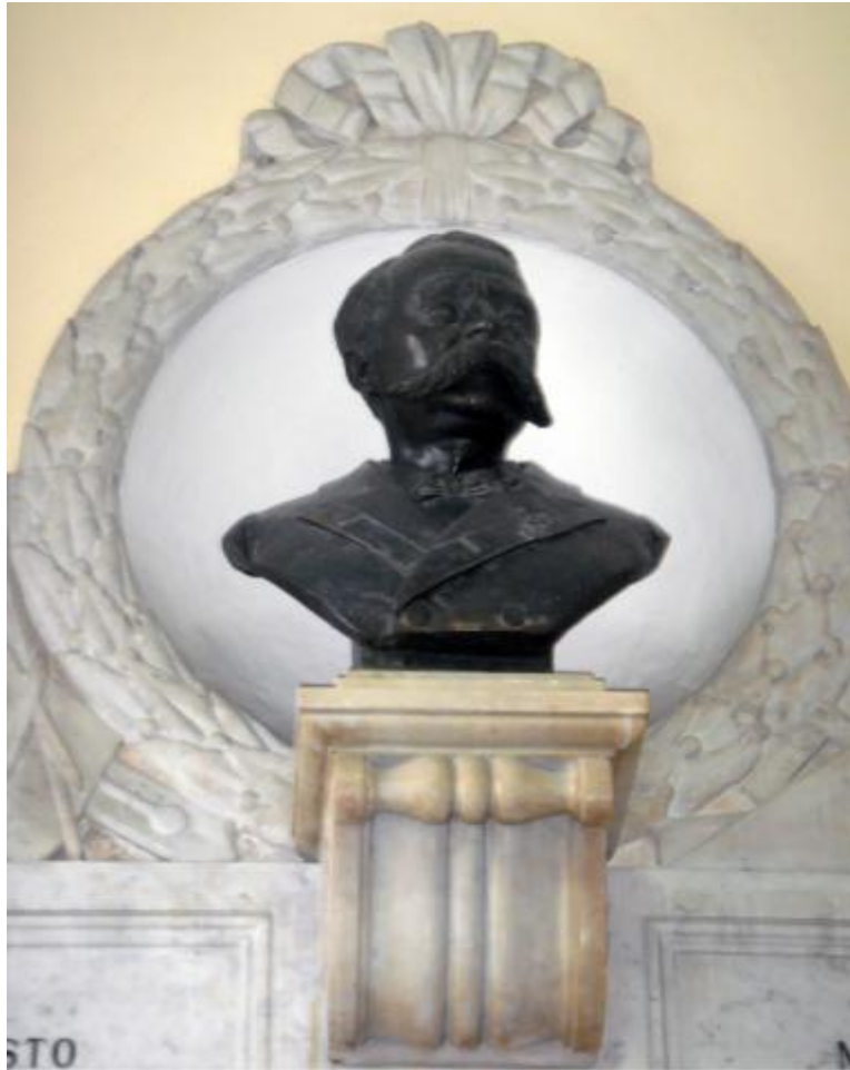
2) Dettaglio del busto