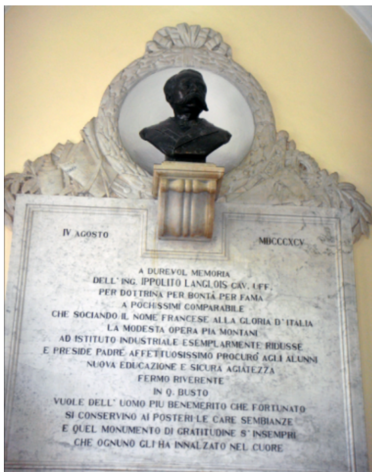
1) Foto della lapide con busto di Ippolito Langlois a Fermo