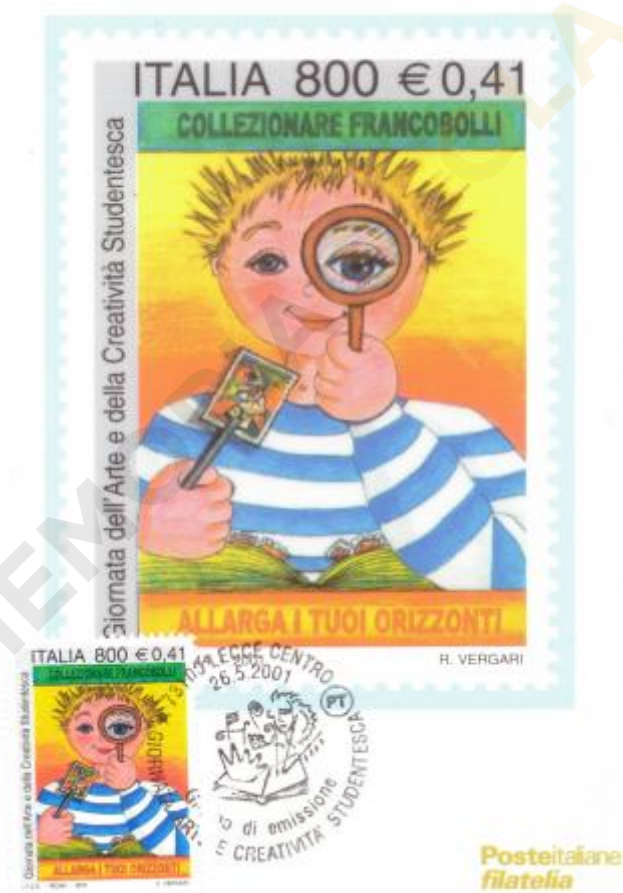
FIG. 4 – Maximum card, emittente Poste italiane, annullo filatelico primo giorno Lecce centro, non viaggiata. CpB