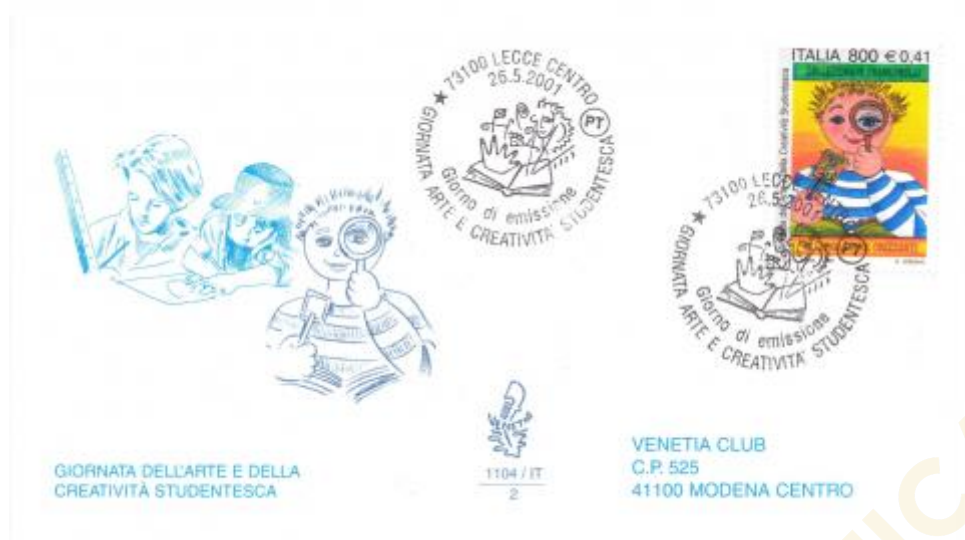
FIG. 3 – First day cover, emittente Venetia, annullo filatelico primo giorno Lecce centro, viaggiata. CpB