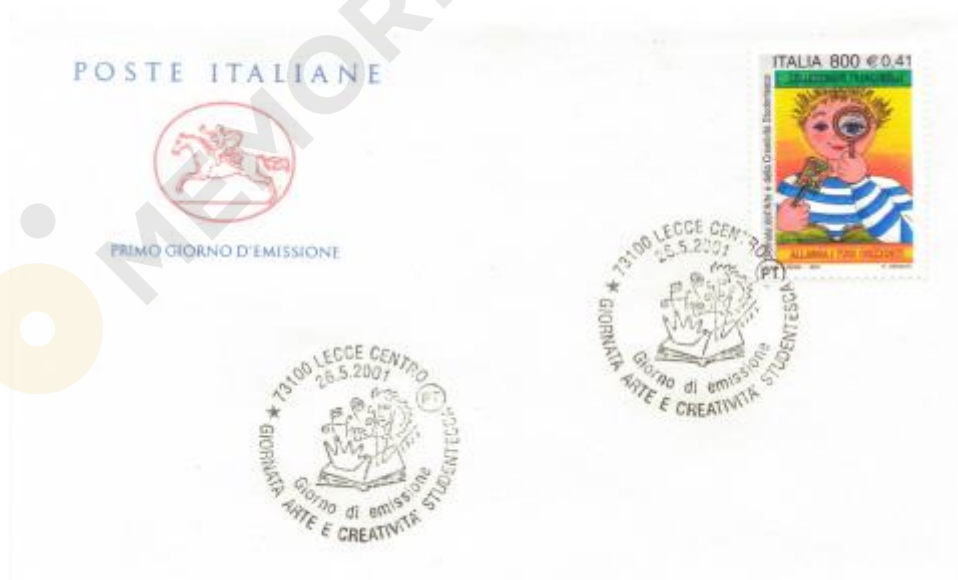
FIG. 2 – Cavallino, emittente Poste italiane, annullo filatelico primo giorno Lecce centro, non viaggiato. CpB