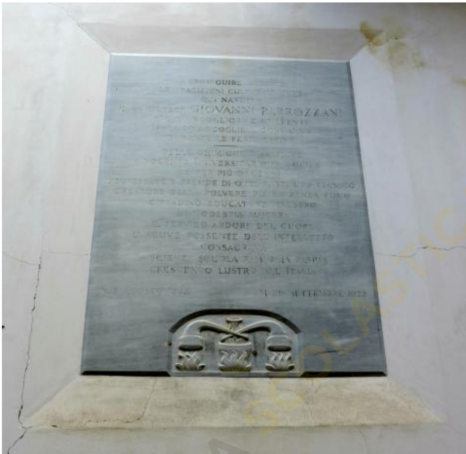
Foto della lapide a Giovanni Parrozzani, opera di Cacciari, a Isola del Gran Sasso