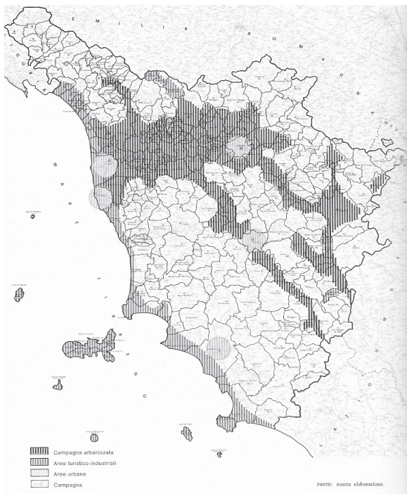
Fig. 2. Cartogramma delle aree tipologiche del modello di sviluppo individuate in Toscana nel 1975

Il tema della riorganizzazione amministrativo-territoriale è stato affrontato, in riferimento alla Toscana, con l'intento di indagare quali possano essere le connessioni tra le proposte di ritaglio territoriale, la creatività e la cultura delle comunità locali. L'indagine è stata stimolata anche da una recente classificazione dell'intero territorio italiano, secondo le diverse vocazioni culturali dei sistemi locali (ISTAT, 2015b). Va subito ricordato che, nonostante gli incentivi previsti dalle leggi nazionali e regionali a favore di una riorganizzazione territoriale, le fusioni di comuni sono estremamente difficili da realizzare, per la resistenza