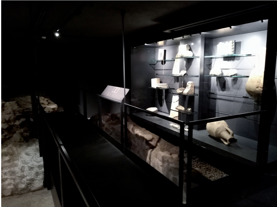
Reperti al Museo Pons Drusi

Drusi , a entrambe queste due divinità venne dedicato il Carmen saeculare , un canto propiziatorio composto da Orazio ed eseguito da un coro maschile e femminile a Roma nella cerimonia dei ludi saeculares che celebravano il nuovo saeculum (un ciclo di circa 110 anni) nella speranza di pace e di prosperità. Quanto al culto nel territorio atesino, a Diana risulta dedicato un altare di età romana rinvenuto a Parcines, conservato al museo Ferdinandeum di Innsbruck, 18 e a Tridentum (sul Dos Trento) fu scoperta in scavi ottocenteschi una lapide dedicata a Diana (oltre che a Mercurio e a Saturno), ora al museo del Castello del Buonconsiglio.