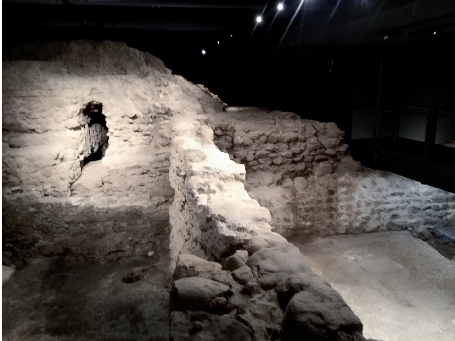
Museo Pons Drusi, resti di edificio

di giardino), e altri elementi che attestano gli arredi del complesso in epoca romana. Tra i reperti sono presenti monete che spaziano da un denario di Giulio Cesare del 47 a.C. a un asse commemorativo del divo Augusto e altri nummi fino al periodo dell'imperatore Teodosio, e molti utensili di uso quotidiano (lame, chiodi, elementi di bardatura, fibule, fusaiole, lucerne, fine vasellame da tavola, anfore), nonché oggetti di ornamento, che testimoniano lo svolgimento di varie attività, il benessere e il senso estetico degli abitanti del luogo nella prima età imperiale.