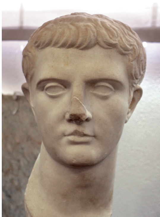
Druso maggiore (da Roselle, Museo di Grosseto)

Verosimilmente Pons Drusi fu dapprima un accampamento o statio militare, divenne poi una mansio (luogo di permanenza, dal lat. maneo “rimango”, anche “pernotto”) e si trasformò rapidamente in un centro abitato con edifici non di rado prestigiosi, come risulta dagli ultimi ritrovamenti risalenti al I sec. d.C. Soprattutto fu un punto di riferimento “stradale”: il toponimo, legato nel nome al comandante romano, è attestato nella Tabula Peutingeriana (segmento IV.3), la carta romana (ora patrimonio UNESCO) che raccoglie le mappe della rete viaria imperiale, probabilmente basata su quella predisposta nel I sec. a.C. da Marco Agrippa, generale e collaboratore di Augusto. Dalla Tabula risulta che Pons Drusi – nella carta Ponte Drusi in caso ablativo (compl. di luogo) – era l’ultimo centro abitato prima dei rilievi montuosi lungo la valle dell’Adige all’imbocco di quella dell’Isarco (come mostra l’orografia rappresentata graficamente), situato tra Tridentum e Sublavio (Chiusa/Colma o Ponte Gardena) 10 a una di-