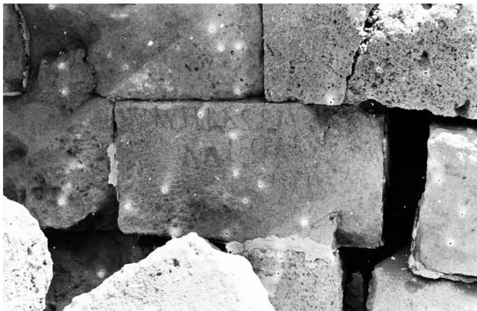
Fig. 4. Sabratha. Anfiteatro. Il titulus pictus 2 al momento della sua scoperta, aprile-maggio 1924. Particolare