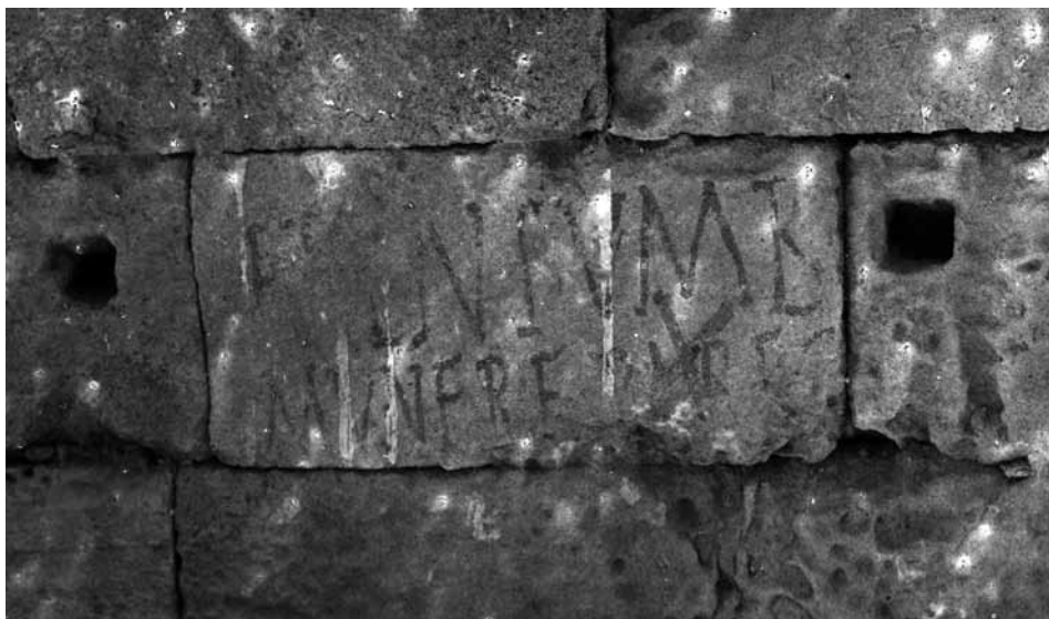
Fig. 2. Sabratha. Anfiteatro. Il titulus pictus 1 al momento della sua scoperta, aprile-maggio 1924. Particolare

numento custodite nell'Archivio CAS ve ne è una che raffigura proprio la suddetta epigrafe (fig. 2) mentre un'altra permette di capire l'ubicazione dell'iscrizione sulla parete nord del corridoio (fig. 3).