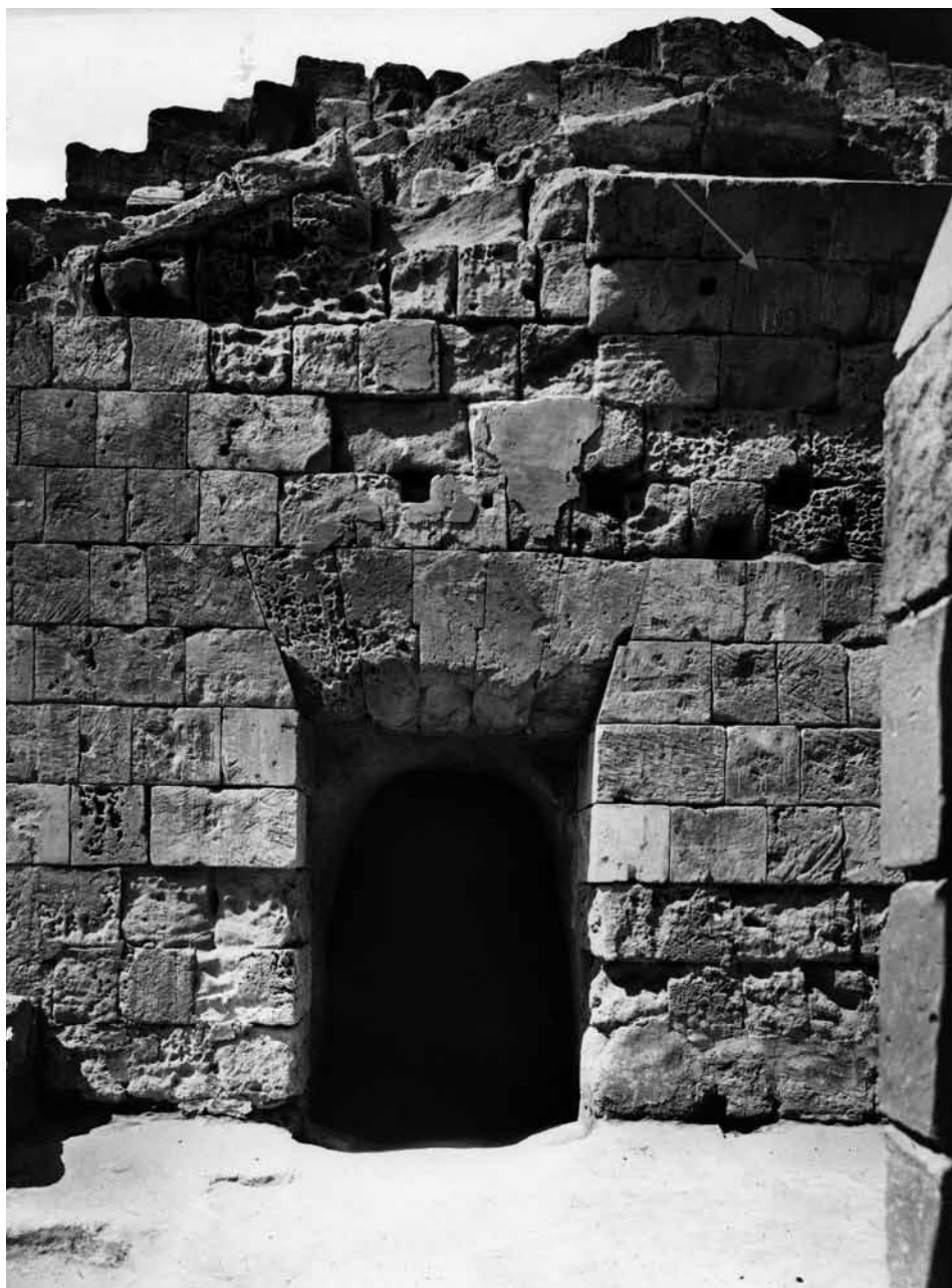
Fig. 3. Sabratha. Anfiteatro. L'ubicazione del titulus pictus 1. Parete nord del corridoio dell'accesso orientale. Da Sud. Archivio CAS, B1276, 00223, sc. 6/36