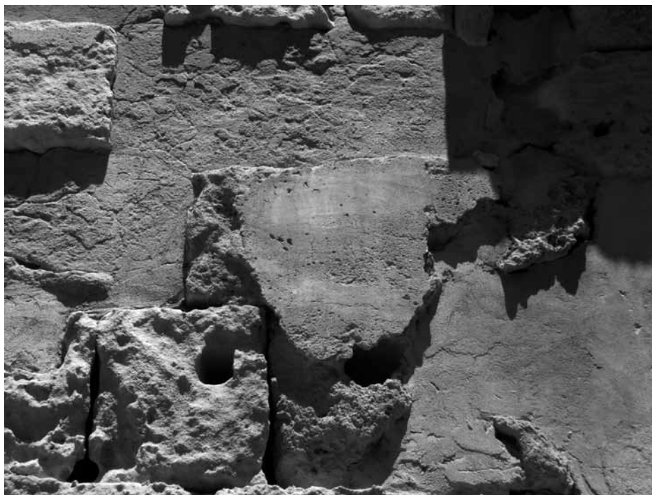
Fig. 5. Sabratha. Anfiteatro. Resti dell'intonaco che copriva le pareti del corridoio d'ingresso orientale, parete nord. Da Sud. Maggio 2012

Bisogna sottolineare come le due iscrizioni siano in pratica un unicum , fra i pochissimi esempi a me noti di tituli picti all'interno di un anfiteatro 19 con la menzione di munera . Il fatto che di norma questo tipo di iscrizioni venisse realizzata sull'intonaco, che raramente si conserva, rende di per sé in generale poco frequente il ritrovamento di queste attestazioni epigrafiche. Anche a Pompei, che ha restituito molti esempi di edicta che annunciano spettacoli gladiatori 20 , non sono attestati esempi di dediche o ringraziamenti per edizione di munera sulle strutture dell'anfiteatro. D'altra parte che i due testi di Sabratha non siano edicta sembra confermato dal fatto che la pubblicità per i giochi andava fatta nelle strade della città e non all'interno dell'edificio da spettacolo.