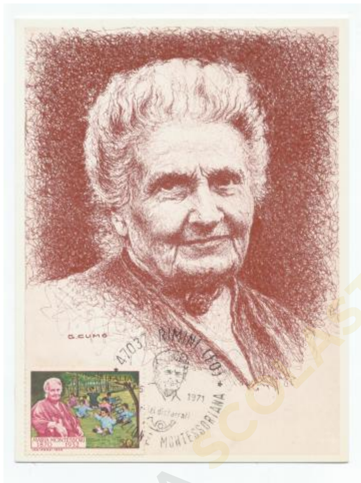
FIG. 7 – Maximum card realizzata in occasione della celebrazione montessoriana tenutesi dal 8-16 maggio 1970 a Rimini, annullo speciale Rimini, non viaggiata. MM – CpB