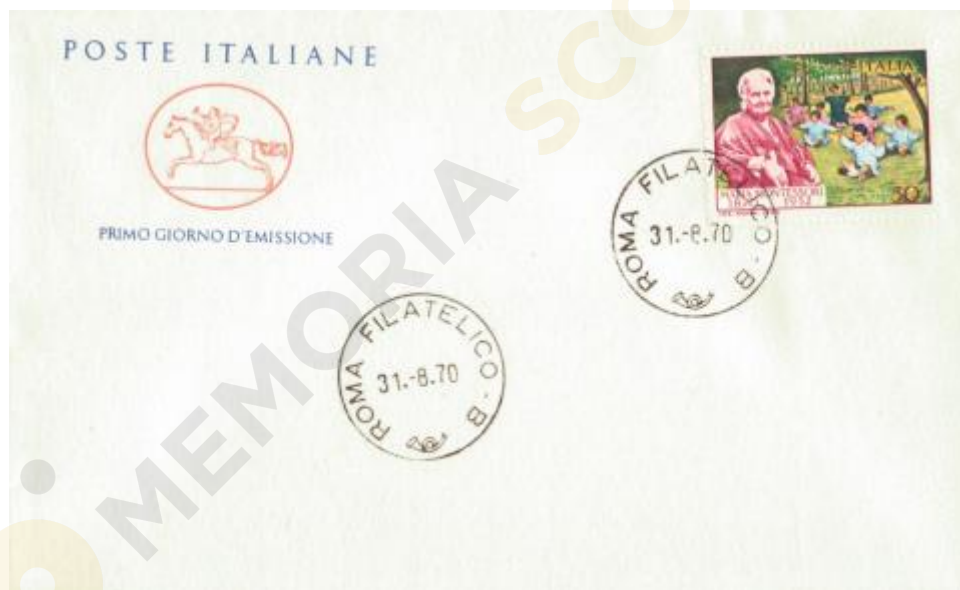
FIG. 2 - Cavallino, emittente Poste italiane, annullo filatelico Roma, non viaggiato. MM - CpB