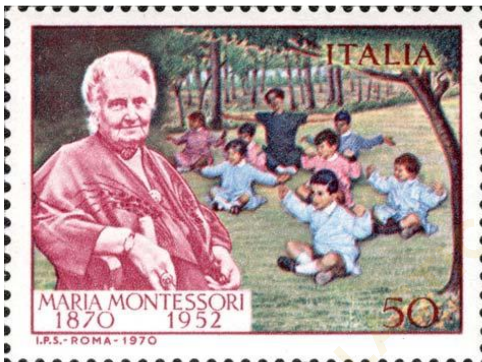
FIG. 1 - Francobollo commemorativo di Maria Montessori nel centenario della sua nascita