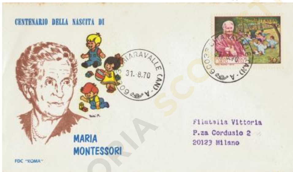
FIG. 4 – First day cover, emittente Roma, annullo Chiaravalle, viaggiata. MM – CpB