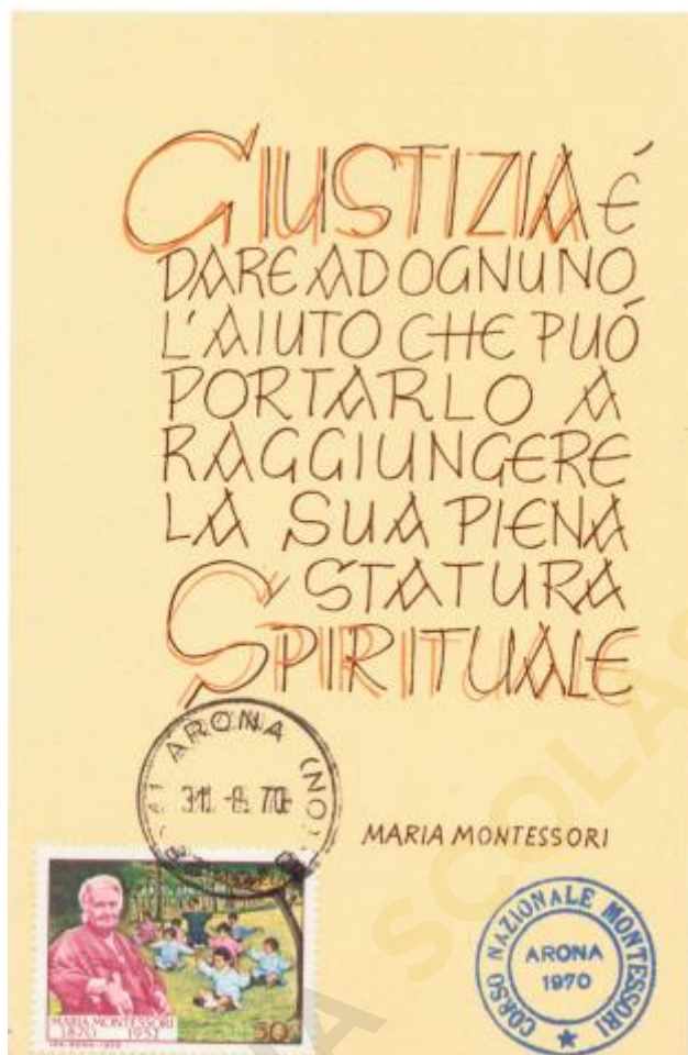
FIG. 6 – Maximum card prodotta nell'ambito del Corso Nazionale Montessori tenutosi ad Arona nel centenario della nascita, annullo Arona, non viaggiata, tre soggetti diversi. MM – CpB