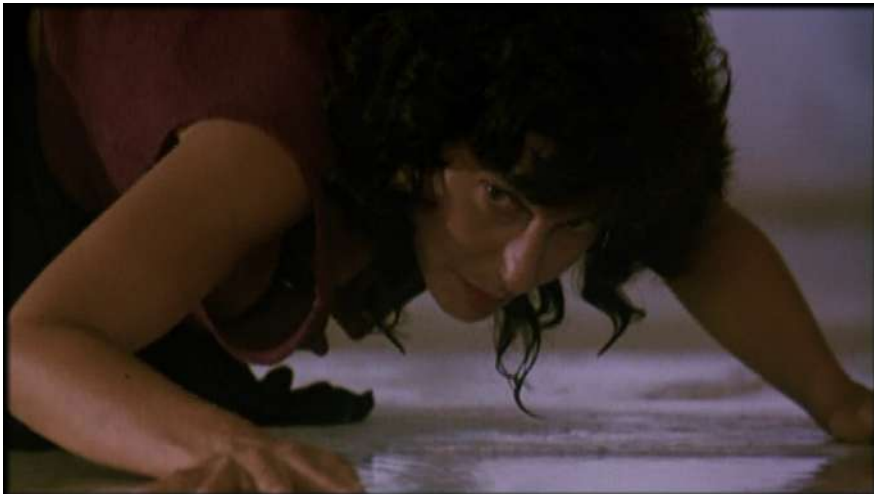
11 | La condanna , regia di Marco Bellochio, 1991.