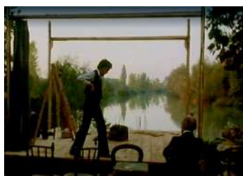
1 | Il gabbiano , regia di Marco Bellocchio, 1977.

Anche se la realtà in cui viviamo fa schifo, bisogna continuare a combattere per provare a gestirla” (Micciché 1980, 284). Una dichiarazione di principio attenta inoltre a rimarcare un ‘presente’ nelle questioni sollevate dal testo di Čechov, nonché il bisogno di riappropriarsi con il proprio linguaggio di un’opera quale Il gabbiano , tanto radicata al peso della terra quanto volta alla ricerca di una leggerezza inespressa.