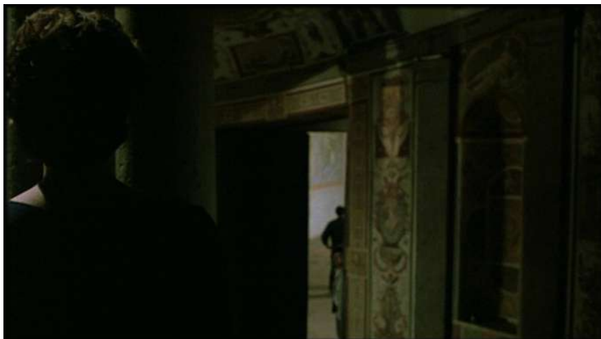
5 | La condanna , regia di Marco Bellocchio, 1991.

La centralità della 'chiusura' come cesura è del resto ossessivamente riproposta in situazioni e parole che trascendono il riferimento al nodo giudiziario ed etico del possesso della chiave. Oltre a soffermarsi sui custodi che accompagnano le porte, abbiamo l'esitazione di Sandra che si trattiene dall'attraversare la striscia di luce del vano, via via ridotta dal movimento della porta verso il battente, per ritrovarsi quindi chiusa dentro, condizione che più volte segnala allo Sconosciuto emerso dall'ombra.