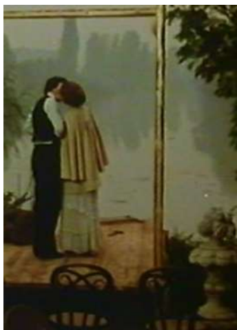
1 | Il gabbiano, regia di Marco Bellocchio, 1977.

a cura di Marina Pellanda e Stefania Rimini