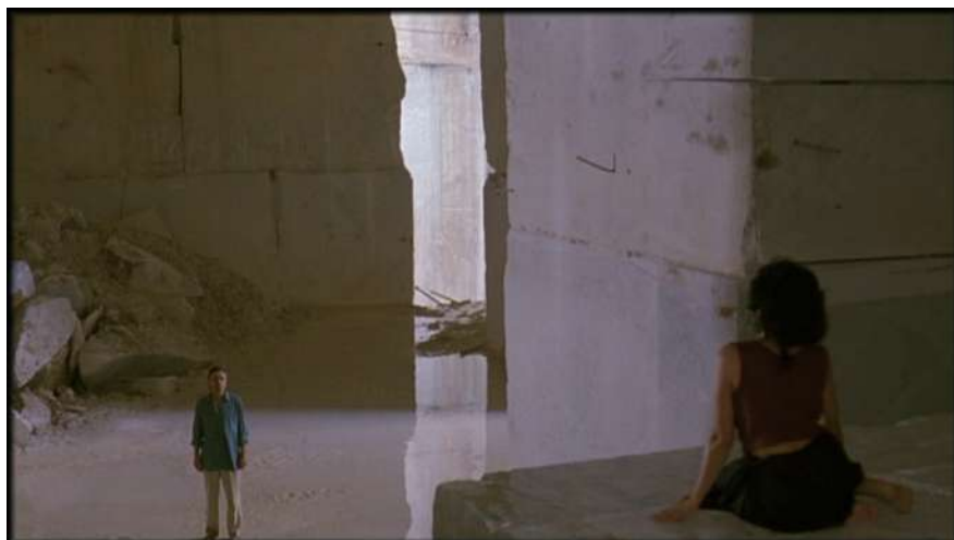
10 | La condanna , regia di Marco Bellocchio, 1991.

Così, la lettura della sentenza di condanna dell'imputato, lungi dal farsi momento conclusivo e dirimente, diviene luogo sacrificale del suo portatore, luogo di una angosciante perdita di sé da cui ha avvio la quête successiva che si snoda tra domande vuote di risposta (non perché non vengano date ma perché non possono essere attraversate) e un vagare restituito con tratti allucinatori in cui i personaggi tornano come epifanie. Riconoscendo nel film la dimensione dell'allegorizzazione e del tracciato maieutico, Stefania Parigi descrive l'inquadratura finale come "trasfigurazione visionaria in cui le tre figure femminili del film entrano ed escono in campo, come in una giostra, in un girotondo di fantasmi che si alternano a fianco del giudice in cammino" (Parigi 2005, 198).