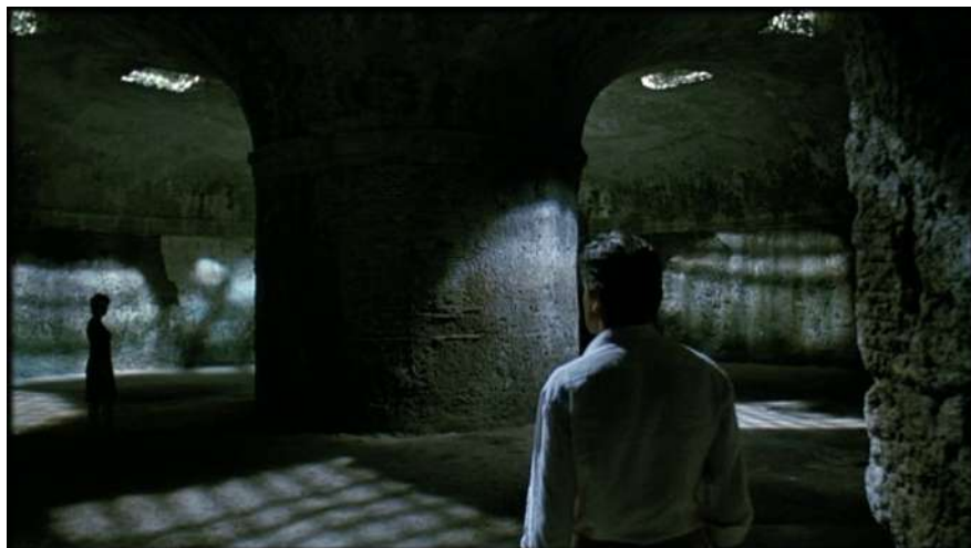
8 | La condanna , regia di Marco Bellocchio, 1991.

A quella lucida formalizzazione capace di “incarnare perfettamente le proprie metafore”, rilevata da Aprà (Aprà 2005, 18), lo spettatore è indirizzato sin dalle prime battute del film nell’interazione tra le parole dei visitatori della villa che udiamo commentarne la forza d’impatto degli elementi architettonici (il movimento impresso dalle colonne), e le geometrie esatte delle decorazioni vegetali del parco, da questi attraversato, in una prefigurazione dell’iscrizione del museo nel movimento aspirante del cerchio-spirale, contrapposto al rigore geometrico distintivo invece dell’esterno.