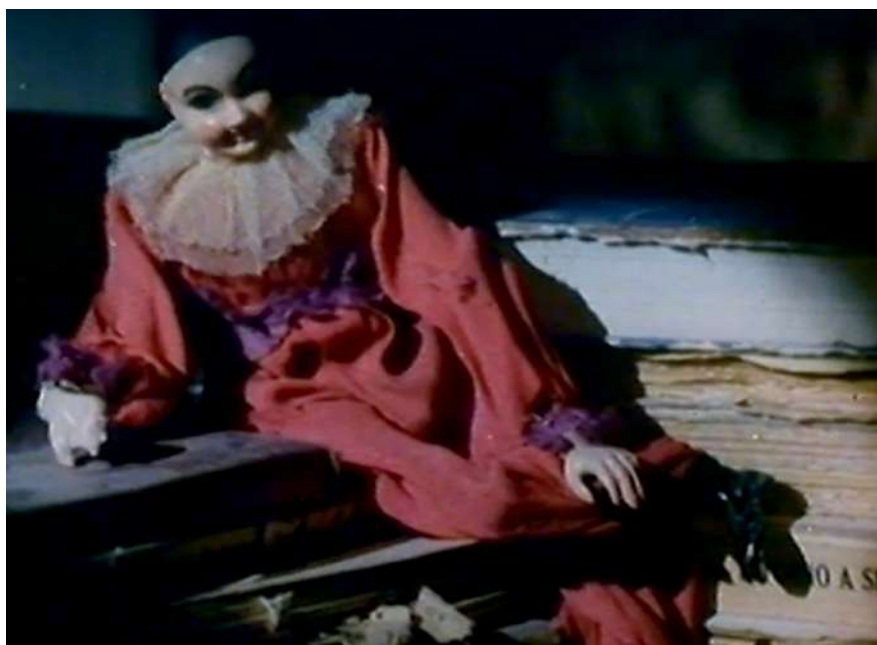
4 | Il gabbiano , regia di Marco Bellocchio, 1977.

Desideravo 'rivisitare' alcuni dei principali temi di tutti i miei film: la rabbia, l'impotenza, l'integrazione, l'invidia, l'omosessualità, il suicidio... e Il gabbiano li contiene tutti. Nella commedia (che ho sempre amato, fin dall'adolescenza) questi temi vengono espressi soprattutto da tre personaggi: Trigorin, lo scrittore di successo, Costantino, scrittore a sua volta ma che rifiuta i compromessi e perciò senza fama e senza soldi, suicidi entrambi, si potrebbe dire, anche se in modo diverso, entrambi succubi di Irina, la madre castratrice (Bellocchio 1978).