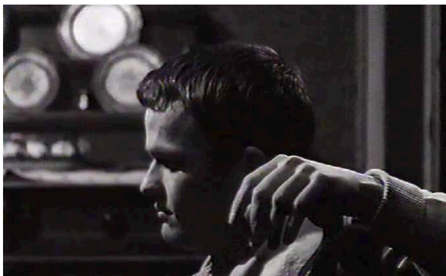
2 | I pugni in tasca , regia di Marco Bellocchio, 1965.

Per raccontare lo spazio chiuso rappresentato dalla villa de I pugni in tasca , Bellocchio sembra chiedere ai suoi attori la stasi piuttosto che il movimento: i corpi, costretti in interni asfissianti, reprimono la pulsione al moto, basti pensare ad Ale che durante il pranzo si dondola aggrappato all'equilibrio instabile della propria sedia e al gesto con cui, per due volte, allunga la mano appoggiandola sul tavolino che ha dietro le spalle.