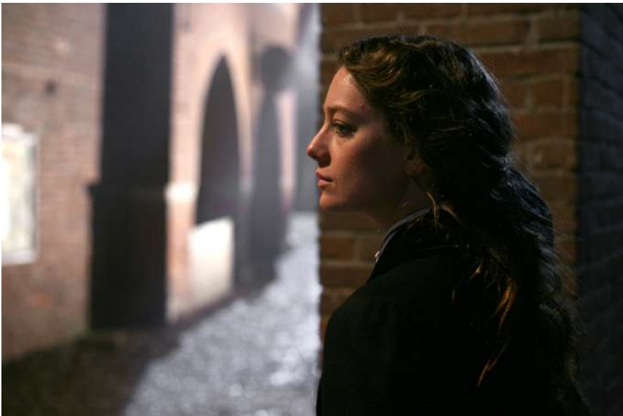
1 | Vincere , regia di Marco Bellocchio, 2009.

parte dice la partecipazione del medico alla malattia dei suoi pazienti, dall'altra traduce il raggirio dei 'cortigiani' del diverso, a cui viene chiesto di 'recitare' per sopravvivere. Niente come il melodramma serve la visione poetica di Bellocchio, la causa di Ida Dalser e la visione del fascismo non tanto come apparato di dominazione ma come passione fusionale, conquista dell'anima, devozione di cuori, trasporto amoroso, orgasmo erotico. Nel suo costante andare e venire tra effusione carnale e adesione politica, lirismo furioso e trance collettiva, Vincere partecipa alla 'nascita di una nazione' che ha trovato nella forma melodrammatica la sua espressione più compiuta.