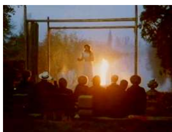
2 | Il gabbiano , regia di Marco Bellocchio, 1977.

di fine Ottocento. Gli interrogativi sulla creazione artistica, divisa tra la necessità di ricercare “forme nuove” e il dovere del “mestiere” come più volte sottolineato dal giovane Kostantìn Gavrilovic, costituiscono uno dei temi cardine del Novecento tanto quanto della nostra stessa contemporaneità [Figg. 1-2].