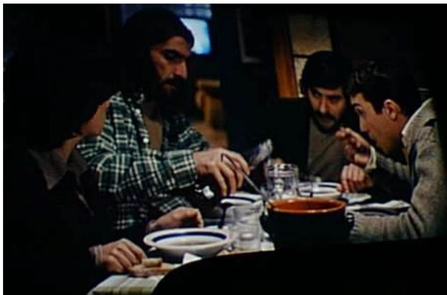
5 | Buongiorno, notte , regia di Marco Bellocchio, 2003.

Il binomio dentro/fuori è allora, in questo kammerspiel di Bellocchio, una contrapposizione tra momenti domestici in cui tutto sembra più piccolo e umano (la quotidianità dei carcerieri attraversata dal sonno, dal cibo, da Raffaella Carrà alla televisione), e momenti invece in cui a prevalere sono i toni claustri legati ai terroristi che, 'soldati della rivoluzione', celebrano un sacrificio tanto oscuro quanto sanguinoso.