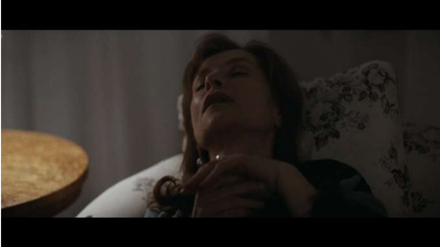
4 | Bella addormentata , regia di Marco Bellocchio, 2012.

sentiamo pronunciare le frasi in cui riconosciamo, anche se con parole differenti ma vicine, il brano del Macbeth : “Sporche! Via! Via! Via! Ancora una macchia... Queste mani non saranno mai pulite...”.