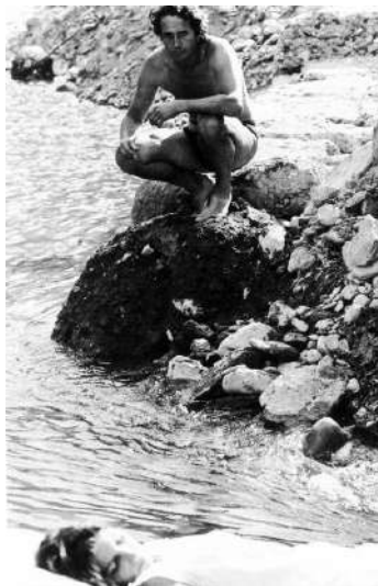
7 | Vacanze in Valtrebbia , regia di Marco Bellocchio, 1980.