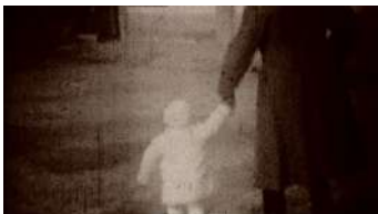
3 | Fotogramma di “...addio del passato...” regia di Marco Bellocchio, 2002.

scena l'aria Addio del passato , momento in cui Violetta si congeda dai sogni di felicità poco prima di morire. Al di là della sovrapposizione di diverse interpreti, ancora una volta irrompono tali immagini che sembrano prendere vita e consistenza dai versi intonati e dal timbro doloroso dell'oboe: è infatti tra la prima e la seconda strofa, proprio nel momento dell'assolo dello strumento, che esse si infittiscono sullo schermo: un padre che tiene per mano il figlio e quest'ultimo che gioca con un altro bambino, le quali vanno ad aggiungersi a una giostra che si era vista qualche secondo prima.