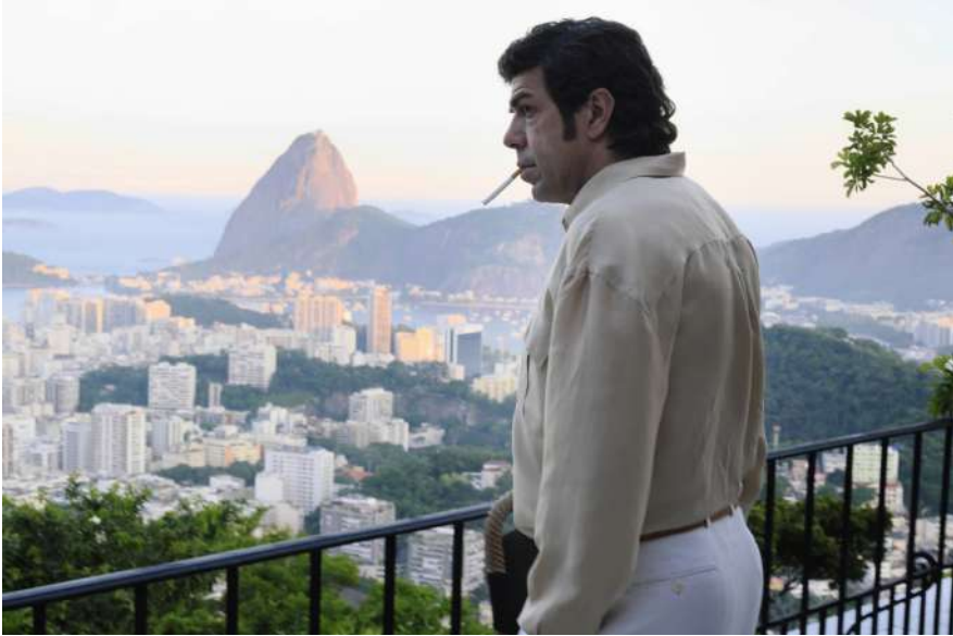
3 | Il traditore , regia di Marco Bellocchio, 2019.