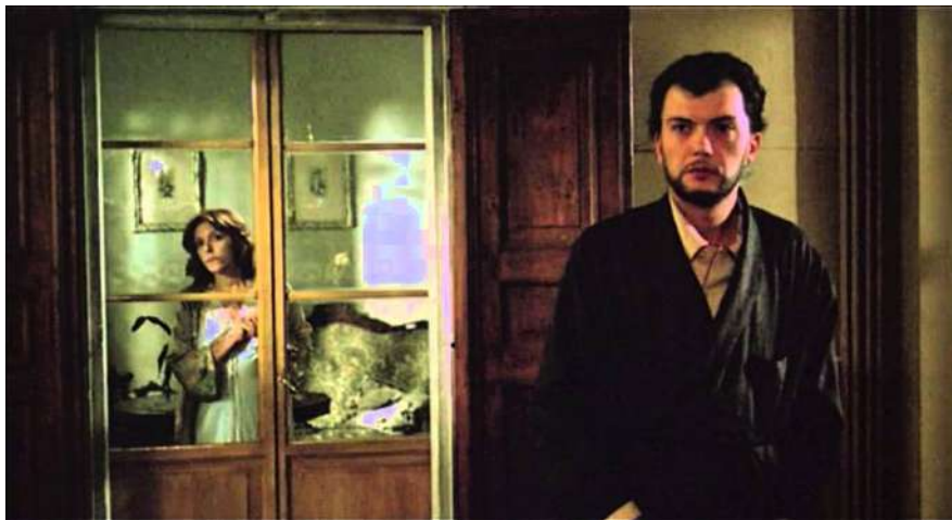
1 | Gli occhi, la bocca , regia di Marco Bellocchio, 1982.

L'unità di luogo permette al cinema di confrontarsi con il teatro. Un confronto che funziona sia quando il cinema attenendosi alle unità aristoteliche raccoglie la sfida lanciata dal teatro antico secondo il quale il palcoscenico, set unico per eccellenza, ha addirittura funzione catartica, sia quando una precisa volontà autoriale – in questo caso quella di Marco Bellocchio – negando i campi lunghi, proibendo l'evoluzione spaziale e ingabbiando i personaggi mostra, da un punto di vista privilegiato, un racconto che non è né teatro filmato né cinema-teatro ma, invece, un film.