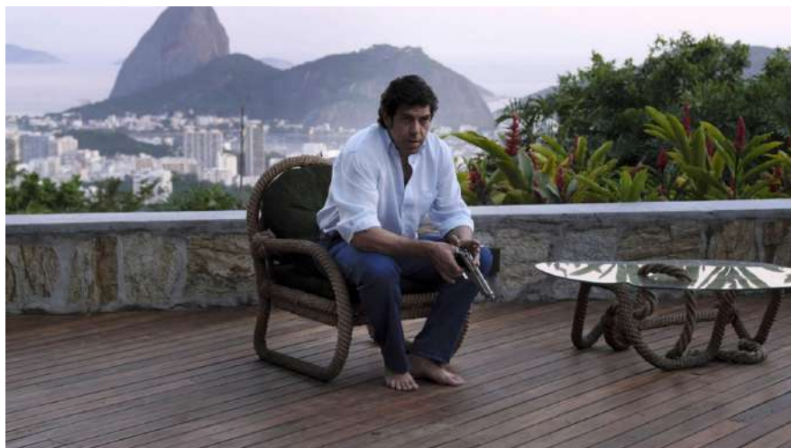
2 | Il traditore , regia di Marco Bellocchio, 2019.

AmMESSO e non concesso che un "traditore" Bellocchio abbia voluto riportare sulla scena dei suoi 'delitti e castighi'. Un "traditore" per così dire, poiché tale non è, salvo considerarne un'accezione diversa, sconcertante, rivelatrice, in cui a recitare sono (stati) in tanti la propria parte nel "gioco delle parti". Pirandello, ancora, del resto è l'altro grande autore cui spesso e volentieri Bellocchio attinge adoperando il filtro teatrale per scardinare cinematograficamente con immagini che la dicono lunga. E la Sicilia rende molto bene, geograficamente e culturalmente, in termini pirandelliani, le dinamiche del potere di cui la mafia è (stata) intermediaria.