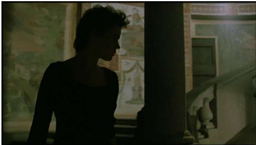
9 | La condanna , regia di Marco Bellocchio, 1991.

Il sorgere del sole e l'uscita, su cui grava il tema dell'inganno, riportano i celebranti al loro statuto umano.