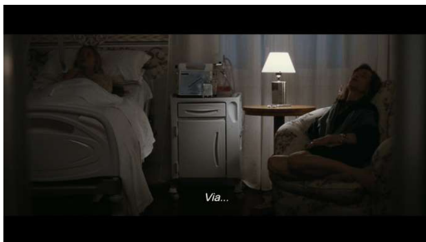
3 | Bella addormentata , regia di Marco Bellocchio, 2012.

Pure il corpo inerme della figlia, estremamente curato, sembra un figurante muto di una messa in scena sorretta da singoli brani che richiamano in più momenti parole e moduli teatrali: il figlio, Federico, anche lui desideroso di divenire attore, prova a recitare Il pianto della Madonna di Jacopone da Todi, il giorno precedente alla prova d'esame presso l'Accademia, dinanzi al volto assente della madre e a quello trattenuto del padre; un a solo pianistico di un giovane amico di Rosa avvolge di suoni la stanza in cui la 'bella addormentata' è immobile nel letto, giovane chiamato a sollecitare con le sue note un risveglio che mai avverrà; un dialogo della Divina Madre con un prelado segnala l'impossibilità per lei di staccarsi dalla interpretazione della 'parte' inseguendo vanamente quella di Santa, e persino la Messa, celebrata in nome del risveglio della figlia, è presentata come una sorta di cerimonia scenica.