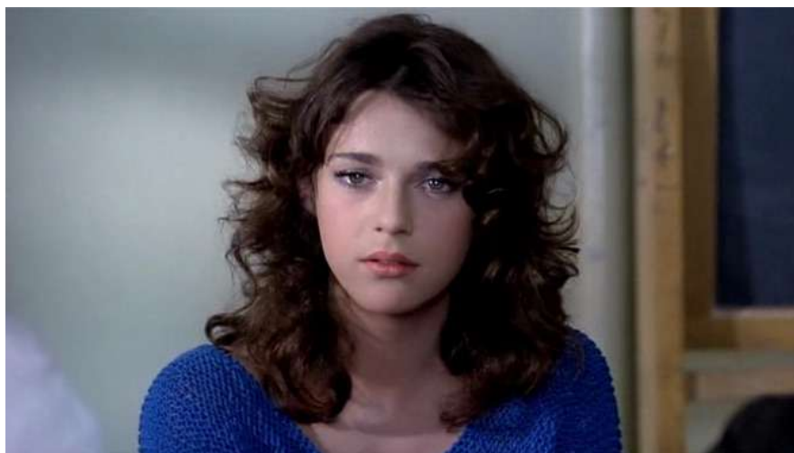
3 | Diavolo in corpo , regia di Marco Bellocchio, 1986.

È così che Bellocchio ci dice come Giulia la pazza, Giulia la sovversiva sia forse una lontana discendente ancora in vita di Antigone, la donna della tragedia greca che oppose la forza del suo desiderio alla barriera inesorabile della legge.