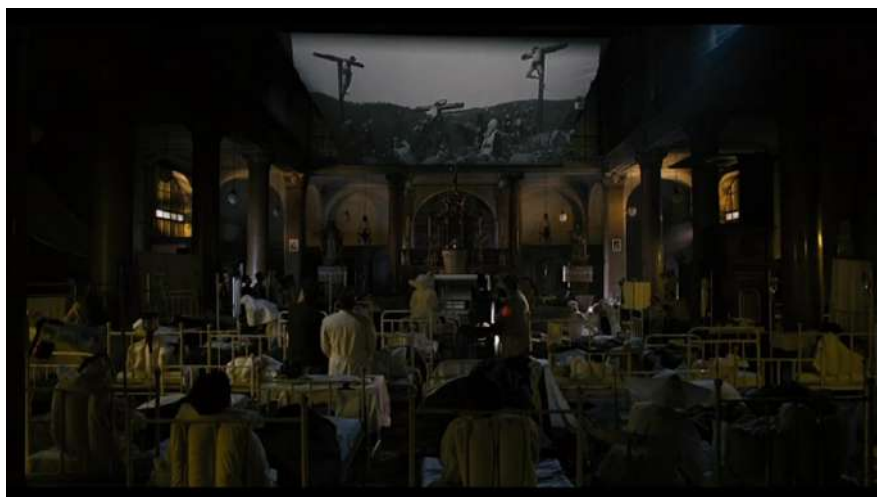
2 | Vincere , regia di Marco Bellocchio, 2009.

Lì, sopra i corpi dei malati e dei feriti che soffrono, il cinema materializza altri tre corpi: quelli della Crocifissione messa in scena da Giulio Antamoro in Christus (1916), con echi iconografici che vengono dalla storia della grande pittura italiana. In Vincere il cinema che affiora nel film non viene più da 'dentro' l'inconscio dei personaggi, ma li sovrasta. Li domina. Sta su, sopra di loro. Pende dall'alto, come se Bellocchio avesse messo lo schermo sul Golgota, o nell'abside di una chiesa sconsecrata: quasi un tableau vivant al posto dei vecchi affreschi, a portare la cognizione del dolore (o la redenzione 'dal' dolore) nel luogo istituzionalmente delegato alla manutenzione dei corpi, e alle pratiche di cura e di 'rimozione' del dolore.