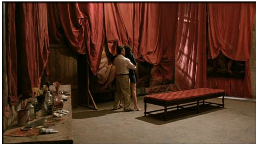
7 | La condanna , regia di Marco Bellocchio, 1991.

corteggiamento e dell'accoppiamento; si spostano con fare sinuoso per poi irrigidirsi bruscamente come figure di un quadro" nella splendida scrittura di Stefania Parigi ( ivi , 196).