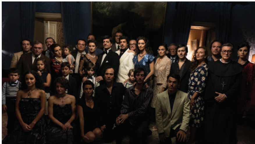
2 | Il traditore , regia di Marco Bellocchio, 2019.

italiano del termine, Bellocchio fa quello che sa fare meglio: regolare i conti con una famiglia mostruosa. Una 'famiglia' a cui non accorda nessun potere di fascinazione, che tratta come una struttura alienante e distruttrice, che considera da sempre il suo nemico intimo.