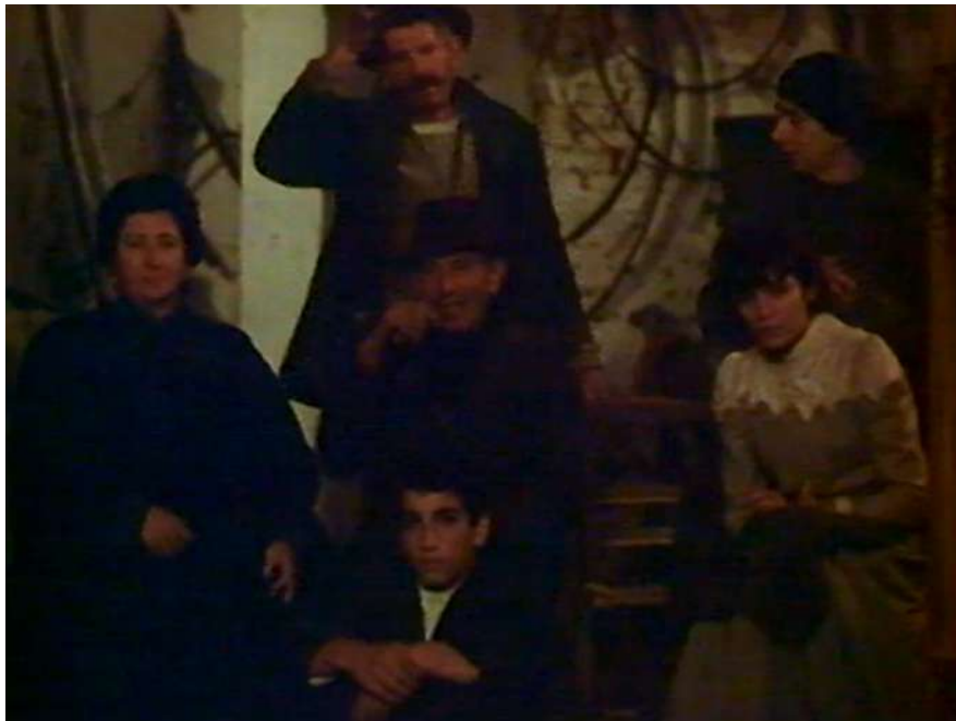
6 | Il gabbiano , regia di Marco Bellocchio, 1977.

Fanno la loro comparsa alcuni contadini, portati ad assistere alla rappresentazione considerata come un esempio del nuovo corso intrapreso dal linguaggio teatrale [Fig. 6]. La loro presenza, inedita rispetto al testo di Čechov, serve da una parte ad amplificare il disappunto e lo smarrimento nei confronti del testo di Konstantin, sottolineandone la scarsa capacità comunicativa e in definitiva il fallimento, ma serve anche a caratterizzare l'opera di Bellocchio con i volti e i luoghi del suo tempo e con la presenza, sullo sfondo, di alcuni canti dialettali qui aventi la funzione di richiamare l'infanzia dell'autore.