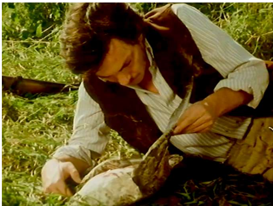
3 | Il gabbiano , regia di Marco Bellocchio, 1977.