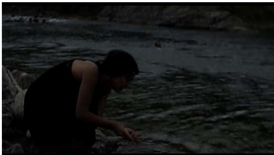
1 | Sorelle Mai , regia di Marco Bellocchio, 2010.

Il Trebbia, battuto dalla pioggia e dal vento, si trasforma in forza generativa, paesaggio che potenzia lo scavo su di sé da parte di Sara per attingere allo stile più proprio e quindi rimodulare la meccanica ripetizione del testo teatrale in forma soggettivata.