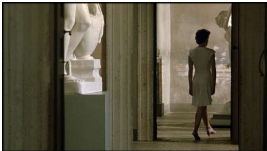
6 | La condanna , regia di Marco Bellocchio, 1991.

Tale enfattizzazione ritorna poi nella parte finale del film, spesso trascurata, in cui è il PM/Malatesta a recarsi al museo. Di nuovo si assiste al 'rito' della chiusura che pone il visitatore di fronte a una scelta. L'uomo deciderà di uscire e, dall'esterno, vedrà (o crederà di vedere, come confesserà al Colajanni) Sandra – già scorta poc'anzi aggirarsi nei corridoi e sale espositive in un immacolato abito bianco che la trasmuta in figura, in una statua animata – affacciarsi a una vetrata, dall'interno.