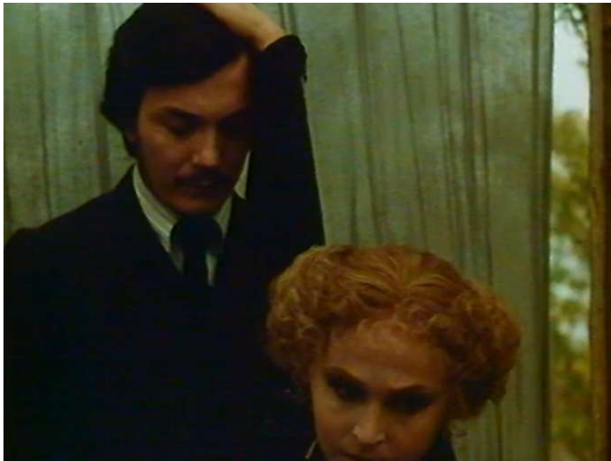
5 | Il gabbiano , regia di Marco Bellocchio, 1977.

Nell'appropriarsi del testo di Čechov, significativo è inoltre il lavoro con gli attori. Il ruolo di Irina Arkadina, della madre di Konstantin, qui interpretato da Laura Betti, non fa che avvalorare ulteriormente una relazione sottotraccia tra le due opere [Fig. 5]: rispetto alla figura materna descritta da Čechov, ammirata e leggiadra, quella creata da Bellocchio diviene ora una figura pressante, non solo distante dalle idee del figlio, ma addirittura opprimente, soffocante, in un modo non dissimile da ciò che Ale, il protagonista de I Pugni in tasca , avverte nella relazione all'interno della famiglia e in particolare con la madre. Bellocchio parla inoltre di un lavoro che mira a portare il testo "fuori dalla classicità" (Bellocchio 2011), scostandolo dal legame con Čechov per darne una visione più ancorata al suo pensiero e al suo vissuto. L'intervento operato dal regista sul modo di recitare e in particolare sull'uso dell'accento dialettale diviene allora determinante. La portata e il valore personale delle "inflexioni dialettali" (Ginzburg 1977) appare di specifico valore nella sequenza della rappresentazione teatrale scritta da Konstantin e messa in scena al cospetto di sua madre, Irina Arkadina, e dello scrittore Borìs Trigorin.