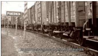
2 | Fotogramma di “...addio del passato...” regia di Marco Bellocchio 2002 ( Preludio del primo atto di La traviata ).

più in là... ohimè! Morivo!”. La musica, unitamente al testo della poesia, diviene quindi parte attiva del processo di costruzione della memoria, si potrebbe dire che i frammenti strappati dal passato principino proprio a partire dalle note verdiane; e le immagini salvate da Bellocchio, inserite come schegge di un tempo remoto, sono tanto quotidiane, quanto cariche di significati simbolici: la ferrovia, Piazza Cavalli a Piacenza, e soprattutto il fiume, “luogo mitico di una origine generatrice di immagini e storie” (Salvatore 2012, 52), come già in Vacanze in Valtrebbia (1980) e più tardi in Sorelle Mai (2010).