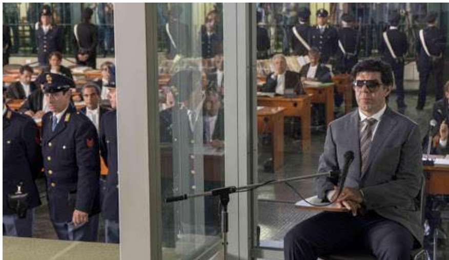
4 | Il traditore , regia di Marco Bellocchio, 2019.

In un saggio, che ha per tema Salto nel vuoto , Orio Caldiron osserva come il ruolo dell'attore girovago Sciabola, pur se almeno in parte sembra liberare Marta dalla coazione a ripetere che definisce il rapporto tra questa donna e il fratello – il quale nella vita, e forse non è un caso, fa il giudice – in realtà non sia via di salvezza ma, piuttosto, evidenzi come la casa in cui vivono i due fratelli Ponticelli somigli a un tribunale: