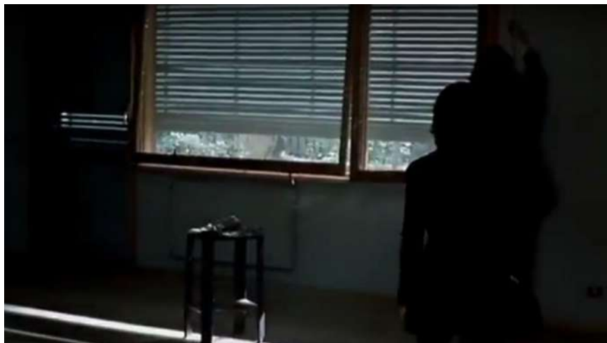
6 | Buongiorno, notte , regia di Marco Bellocchio, 2003.

benedice la casa. [...] Se io mi fossi limitato rigidamente a un tipo di inquadratura fissa, avrei rischiato per quello che volevo fare io una perdita di sentimento, una perdita di emozione. Per questo ho avvertito il bisogno di vari palcoscenici, vari sipari (Bandirali, D'Amadio 2004, 34).