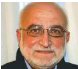
di Italo Tanoni*