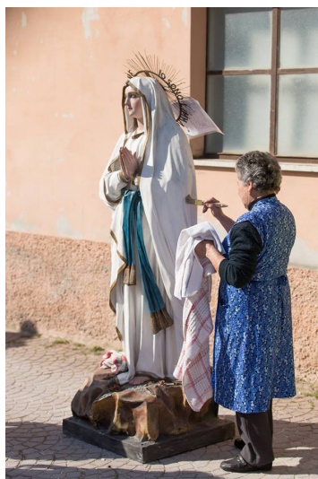
Fig. 2. Treia, 3 marzo 2017, intervento presso la chiesa del SS. Crocifisso (Foto di Luca Marcantonelli, Con in faccia un po' di sole )