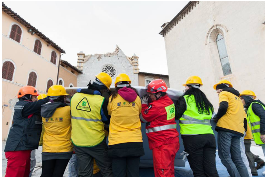
Fig. 1. Visso, 16 novembre 2016, intervento presso il Museo civico diocesano (Foto di Lucia Paciaroni, Con in faccia un po' di sole )