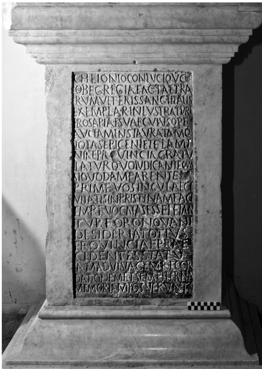
Fig. 1 – La base dei Foronovani con dedica a Cheionius Contucius.