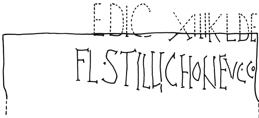
Fig. 3 – Apografo dell'iscrizione laterale con ricostruzione della l. 1 (disegno di S. Antolini).

di Dic(embres) ; la perdita della C finale della linea 1 e della S finale della linea 2 a causa dei guasti della pietra. Se ne deve concludere che il taglio della parte superiore della base ha parzialmente cancellato anche la prima linea dell'iscrizione della faccia laterale. Questo dato attesta in maniera convincente che l'iscrizione laterale era già presente quando la parte superiore della base fu asportata e che non si tratta quindi di un'aggiunta moderna 18 .