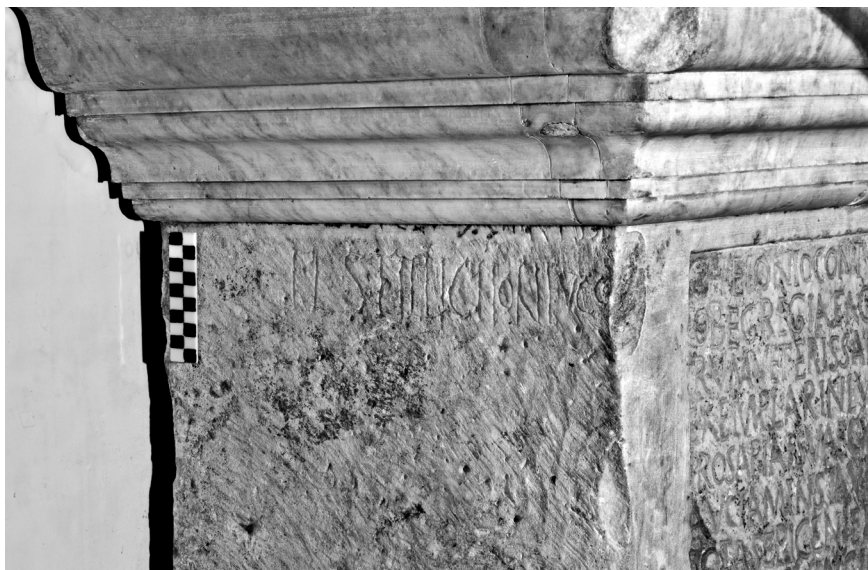
Fig. 2 – L'iscrizione della faccia laterale (per gentile concessione del MIBACT - Museo Nazionale Romano e Galleria Nazionale di Palazzo Barberini).

Come si vede dalla fotografia (Fig. 2), sulla faccia sinistra è perfettamente leggibile la linea iscritta FL STILLICHONE V C CO con la O inclusa nella C e la S finale perduta a causa di una scheggiatura dello spigolo 16 ; al di sopra, nonostante il taglio della pietra, restano evidenti tracce della parte inferiore di buona parte delle lettere di una prima linea, che si possono riconoscere come EDIC e XIII KL DE con C in frattura (Fig. 3); il testo recuperato corrisponde a quanto la tradizione aveva trasmesso in forma completa, ma con alcune differenze: una diversa impaginazione (2 linee iscritte contro le 4 di Cassiano dal Pozzo e le 5 dell'Angeloni e del Gudius); le lezioni Stillichone con geminata in luogo di Stilichone 17 e De[c](embres) in luogo