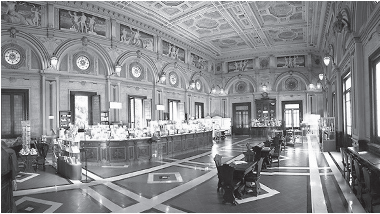
Fig. 3. Bar all'interno dello stabilimento termale Tettuccio