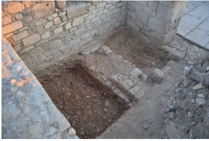
Εικ. 2 : Νότιο Κτήριο πλησίον της Βυζαντινής Συνοικίας της Γόρτυνας: ο υστερορωμαϊκός τοίχος.