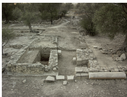
Εικ. 6 : Δωμάτια 47 και 47a που είναι σ' επαφή με το Νότιο Κτήριο πλησίον της Βυζαντινής Συνοικίας της Γόρτυνας.