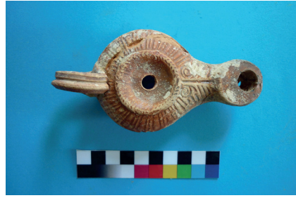
Εικ. 3 : Λύχνος με φύλλο κισσού από τη Γόρτυνα.

θεμελιώνονται οι περιμετρικοί τοίχοι από ογκολίθους ασβεστόλιθου, γενικώς σε δεύτερη χρήση. Επάνω σε αυτό τοποθετήθηκε η προετοιμασία ενός δαπέδου με ορθογώνιες πλάκες ασβεστόλιθου. Στο δωμάτιο 52b, όπου διατηρείται το δάπεδο στο σύνολό του, σώζεται μια tabula lusoria , που χαρακτήριζε όταν πια δεν βρισκόταν στην αρχική της θέση.