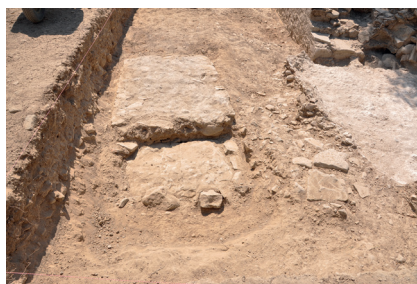
Εικ. 5 : Βυζαντινή ταφή στον διάδρομο βόρεια του Νοτίου Κτηρίου πλησίον της Βυζαντινής Συνοικίας της Γόρτυνας.

Σε μια επόμενη φάση, που τοποθετούμε στον 7ο αι. μ.Χ., χωρίς να μπορούμε να πούμε πριν ή μετά τον σεισμό του 670, στο εσωτερικό των δωματίων 47a και 47b ανυψώνεται το δάπεδο (US 921) αποτελούμενο από κόμα και πολλά θραύσματα οπτοπλίνθων. Αυτό σχετίζεται με μια τακτοποίηση της εξωτερικής ζώνης του Βορείου Διαδρόμου, από τον οποίο προέρχονται μεταξύ άλλων κεραμική LRC, η φόρμα Hayes 10C (αρ. 921.13,58) που χρονολογείται στο πρώτο μισό του 7ου αι. μ.Χ., και ύστεροι αιγαιακοί αμφορείς που χρονολογούνται μεταξύ του 7ου και 8ου αι. μ.Χ. Η ανύψωση πραγματοποιήθηκε από ένα ευρύ και παχύ συμπαγές στρώμα από κόμα πλούσιο σε όστρακα (US 1018). Από αυτό προέρχονται κεραμική LRC Hayes 10C (αρ. 1018.2, 7, 9), αφρικανική κεραμική (A.R.S.W.) παραγωγής D, η φόρμα Hayes 106 και 99 (αρ. 1018.14, 11), που χρονολούνται στον 7ο αι. μ.Χ., αμφορείς TRC10, Eglof (αρ. 1018.226, 221) και αιγαιακοί, που τοποθετούνται μεταξύ του 7ου και 8ου αι. μ.Χ., καθώς και πολυάριθμα γυάλινα θραύσματα (λυχνάρια και κύλικα). Αυτά τα τελευταία, αν και χρονολογούνται