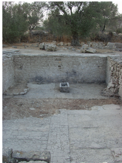
Εικ. 4 : Το δωμάτιο 53 του Νοτίου Κτηρίου πλησίον της Βυζαντινής Συνοικίας της Γόρτυνας.

Σε μια περίοδο, από ό,τι φαίνεται μετά τον σεισμό του 618-620 μ.Χ. (Di Vita 1979-1980, 435-440 και Di Vita 1996, 45-50), η ανασκαφή επέτρεψε να εντοπίσουμε τη δεύτερη χρήση του κεντρικού χώρου. Όντας πια ένα είδος υπαίθριας αυλής (εικ. 4), φιλοξενεί μια γούρνα κρήνης ως ποτίστρα, ένα μικρό παχνί και μια ξύλινη στέγη (Fabrini 2009, 21-22· Fabrini & Perna 2009, 122).