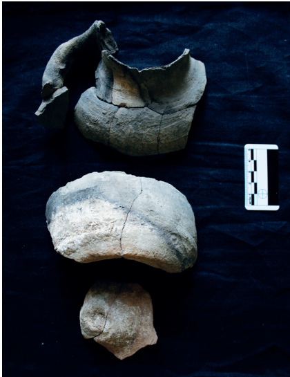
Εικ. 7 : Χύτρα (αρ. 930.13) από χονδροειδή πηλό.