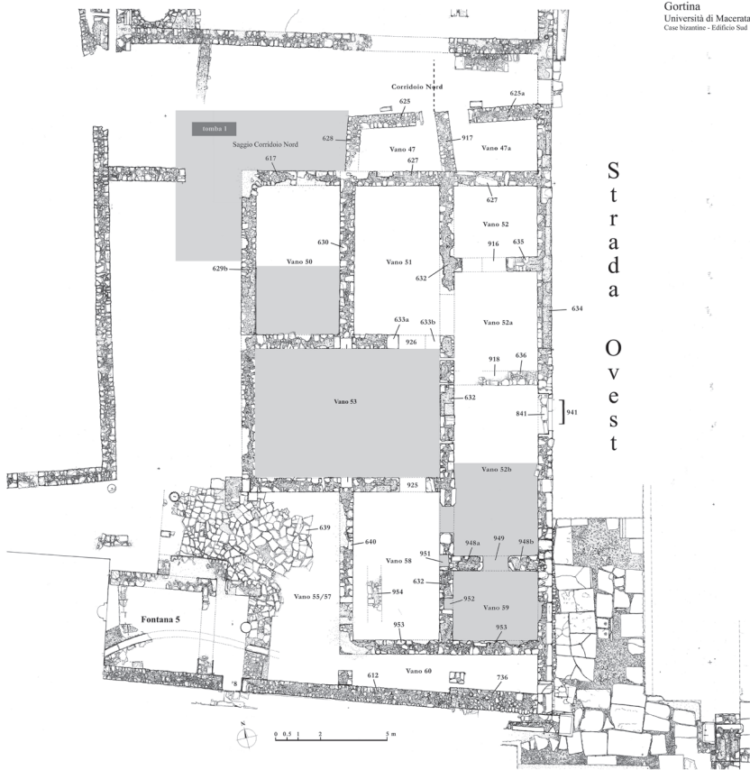
Εικ. 1: Κάτοψη του Νοτίου Κτηρίου πλησίον της Βυζαντινής Συνοικίας της Γόρτυνας.

λάμιου, στις στενές πλευρές, διαρθρώνονται δύο μικρά τετράγωνα δωμάτια (52 και 59). Απέναντι, προς τα δυτικά, δύο μεγάλες αίθουσες, η μία απέναντι στην άλλη (51 και 58), πλαισιώνουν και οδηγούν στην κεντρική αίθουσα.