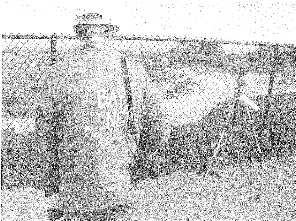
Volontario al lavoro di fronte ad una delle spiagge "sensibili" del Santuario

Per quanto riguarda, invece, le importanti fun-