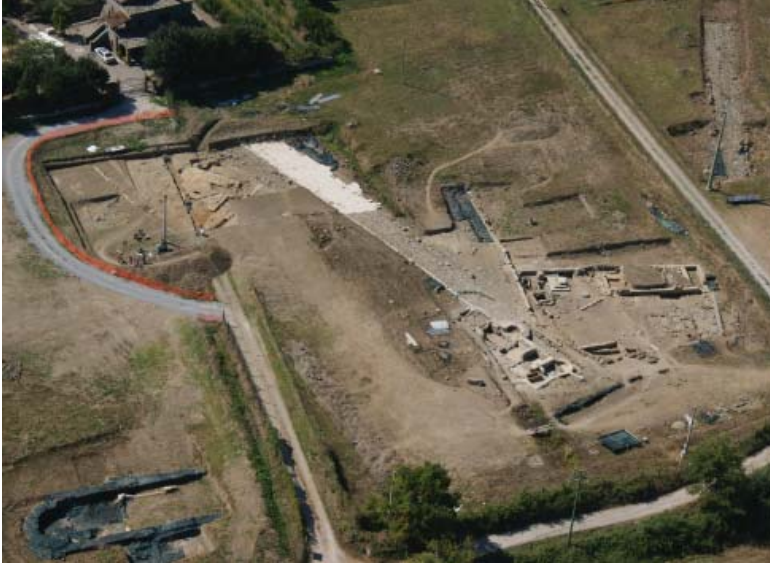
Fig. 2. Il settore centrale dello scavo con le strade basolate