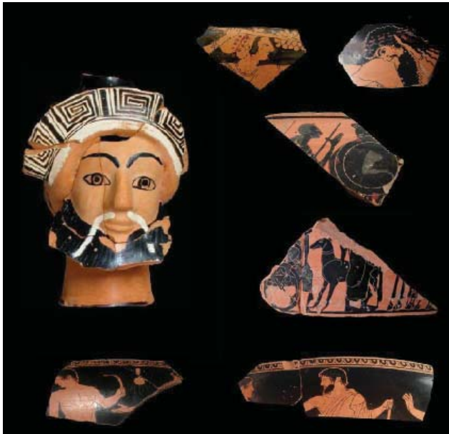
Fig. 7. Ceramica attica figurata