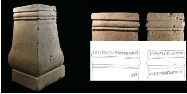
Fig. 8. La base iscritta con dedica alle Thuschva