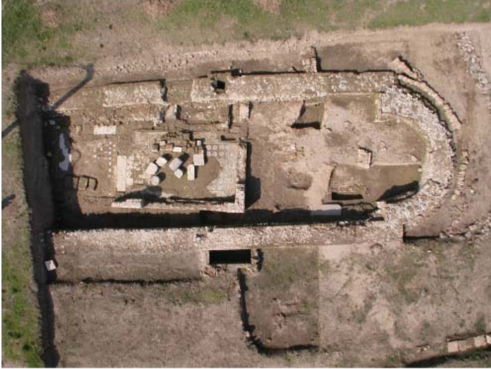
Fig. 6. La chiesa di S. Pietro in Vetere (o Vetera )