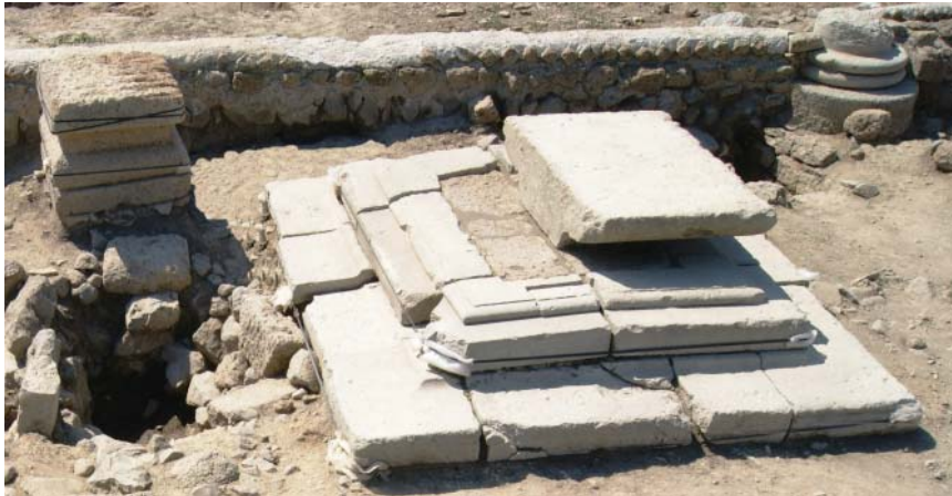
Fig. 3. L'altare monolitico in tufo (a sin.) e l'altare/donario in trachite (a des.)