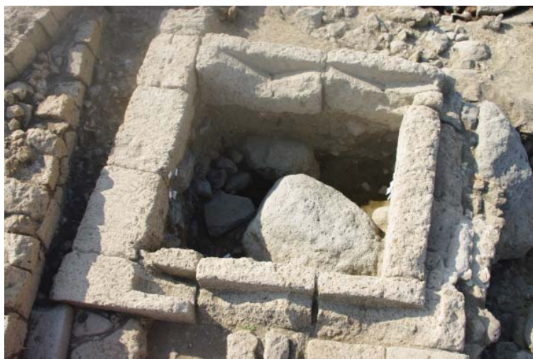
Fig. 5. La struttura quadrangolare con il grande masso naturale