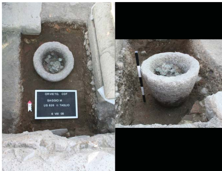
Fig. 4. Il thesaurus con le monete in corso di scavo