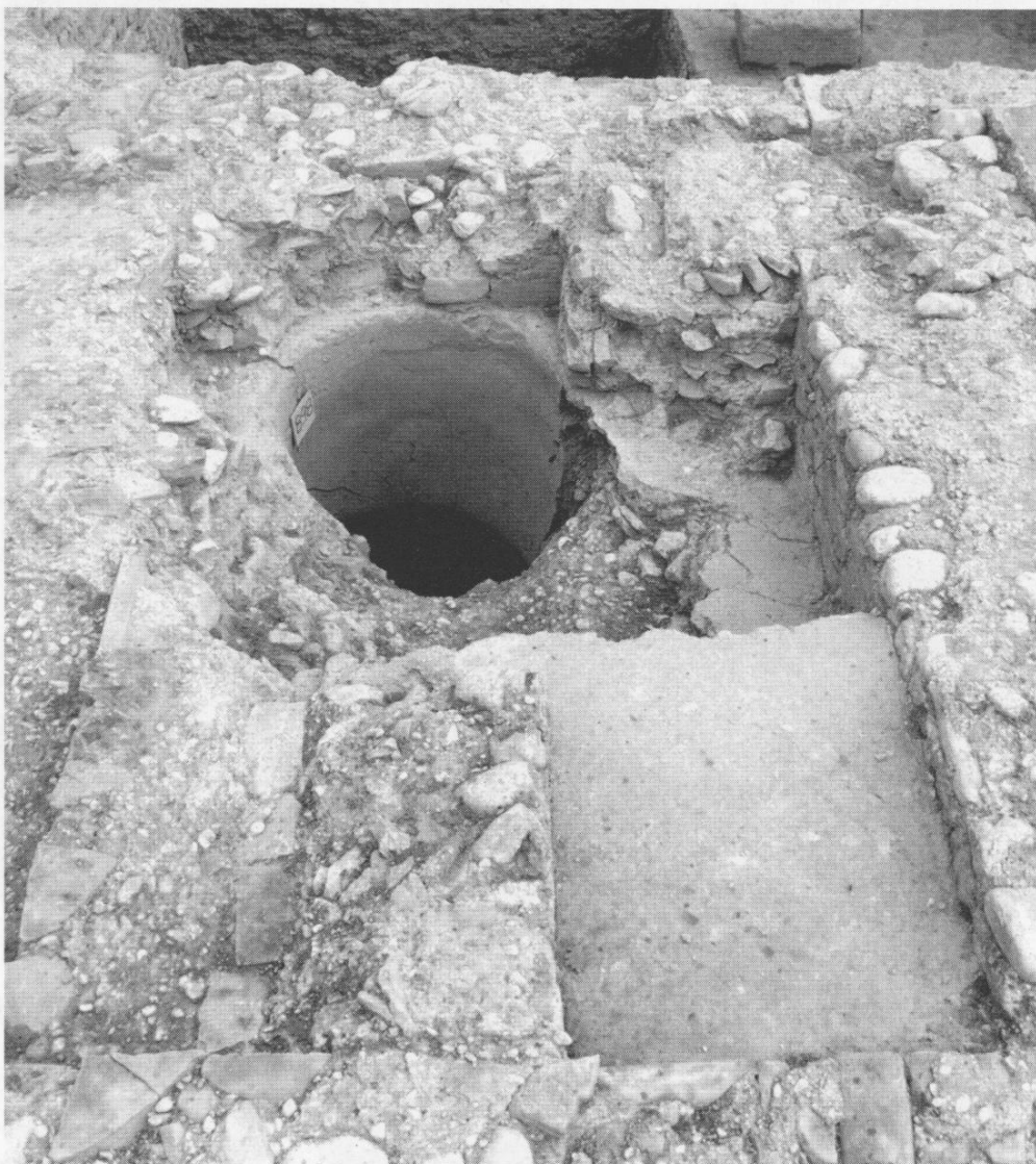
Fig. 14 - Edificio «delle acque»: Ambiente 6. Al centro l'imboccatura del pozzo 898 (da Est).

In un momento successivo l'Ambiente 6 viene allestito in maniera alquanto complessa: innanzitutto viene tamponata con il setto murario 1276 l'apertura sul lato Ovest, quindi viene realizzata sul lato Nord la vasca 2 di cui rimane la pavimentazione in cocchiopesto 1259 (47), addossata al muro perimetrale Nord 849 e delimitata sugli altri lati da tratti murari (risulta realizzato ex novo quello Sud 1263) che ne costituiscono le pareti; nel corso di tale riassetto a Sud della vasca 2 e in riferimento alla presenza del pozzo 898 vengono realizzate piccole strut-