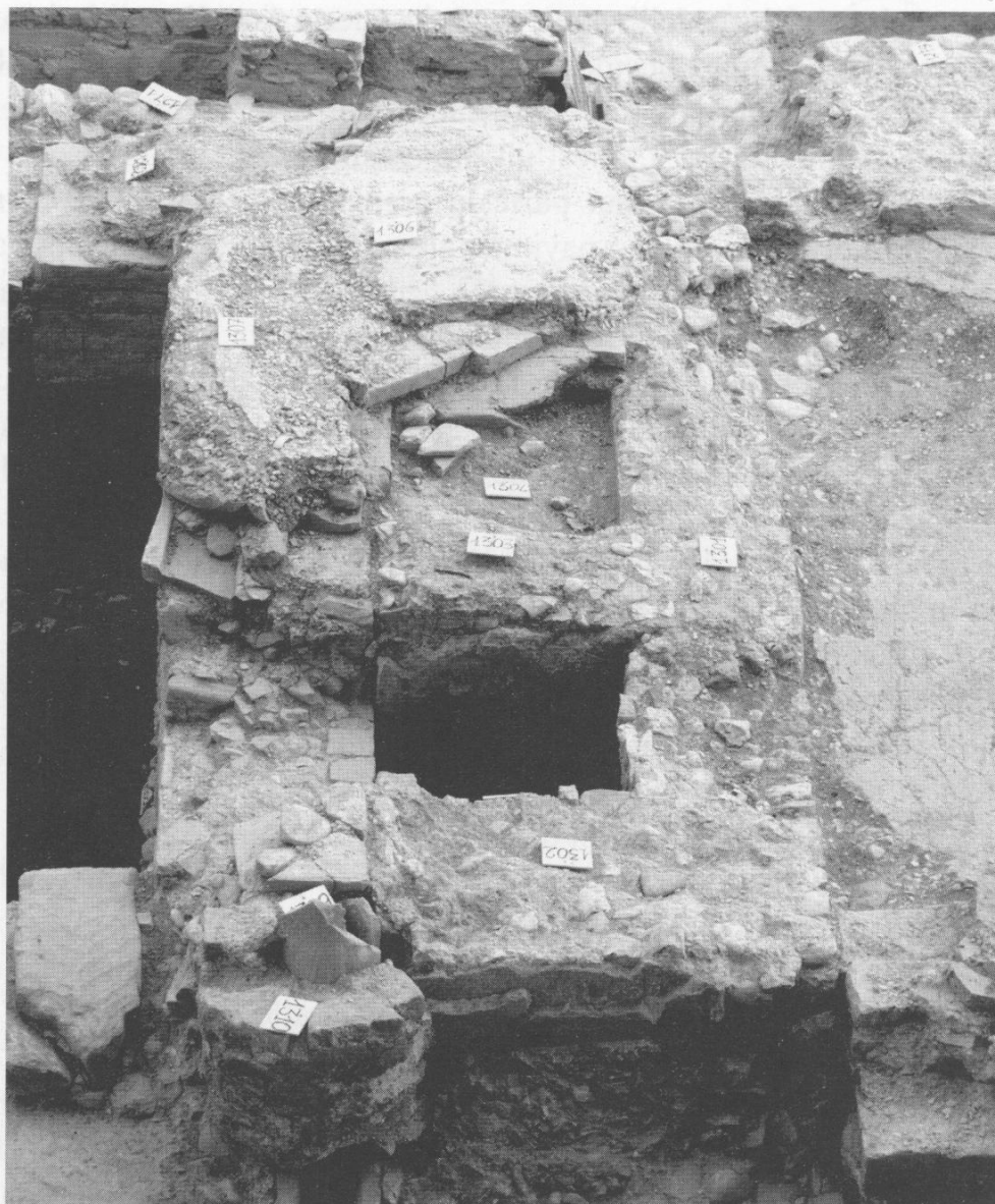
Fig. 13 - Edificio «delle acque»: Ambiente 2. Apprestamento con «pozzetti»; al di sopra i resti di un pavimento tardo di V fase (da Ovest).

ficoltà di natura operativa, era costituito nella parte superiore del corpo (collo e spalla) da pareti realizzate in terracotta che plausibilmente andavano a raccordarsi – per quanto si è potuto vedere – con una vera e propria camicia in ciottoli e pietrame: l'ipotesi più plausibile vede in una tale sistemazione l'apprestamento di un pozzo di captazione di una polla d'acqua sorgiva (46). Caratteristica che – come vedremo nel suo insieme – appare densa di significato.