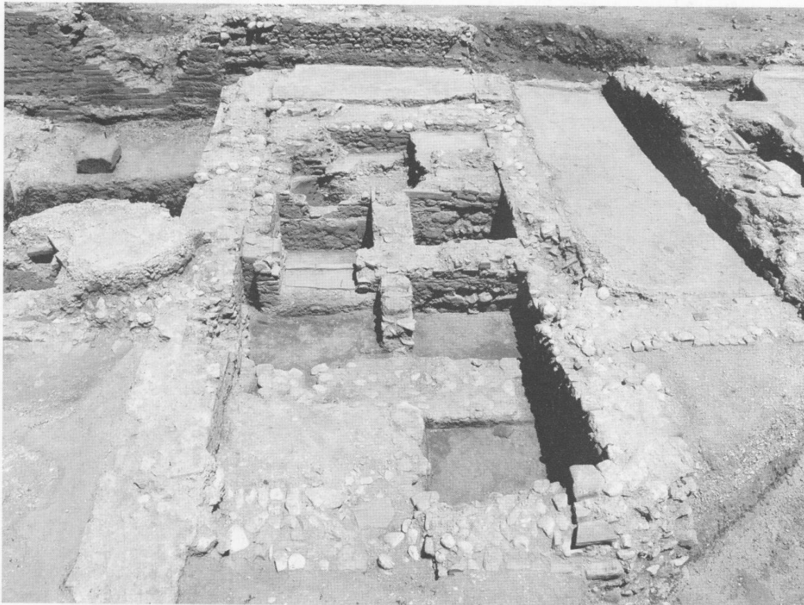
Fig. 15 - Edificio «delle acque»: Ambiente 6. Strutture modulari connesse all'uso dell'acqua (da Sud).

ture diverse di forma pressoché quadrata o rettangolare, quasi modulari (Fig. 15), definite da brevi tratti murari di piccole dimensioni (48), non sempre evidenti nelle loro funzioni, ma certamente poco elevati in altezza. Chiara risulta peraltro la stesura in questo tempo di un nuovo piano pavimentale sempre in cocciopesto U.S. 1265 a Est del pozzo 898 e che va a costituire un gradino rispetto al precedente piano 1266 adesso ripreso. Nelle adiacenze Sud del pozzo 898 poi si apre una vaschetta che conserva il rivestimento in malta idraulica in parte sulle pareti e per intero sul fondo (U.S. 1258), dove si colloca un foro di deflusso (49). A Est di tale vaschetta, la presenza di uno strato di ghiaietto (U.S. 1228) su argilla rossastra, identico a quello su cui posa il piano pavimentale in cocciopesto U.S. 1265 di cui si è detto, consente di immaginare anche in questo caso lo stesso tipo di pavimentazione perduta. Il rinvenimento poi all'angolo