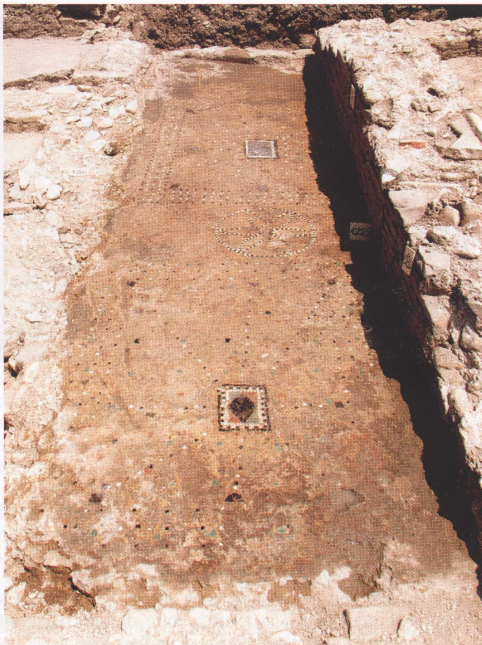
Fig. 16 - Edificio «delle acque»: Ambiente 7. Il pavimento in opus signinum decorato (da Sud).

Sud-Ovest dell'Ambiente 6 di un lembo di pavimentazione ancora una volta in cocciopesto (U.S. 1253) e la identica situazione stratigrafica rinvenuta (ghiaietto su argilla rossastra U.S. 1256) suggeriscono la stessa sistemazione anche nel settore Sud dello stesso ambiente.