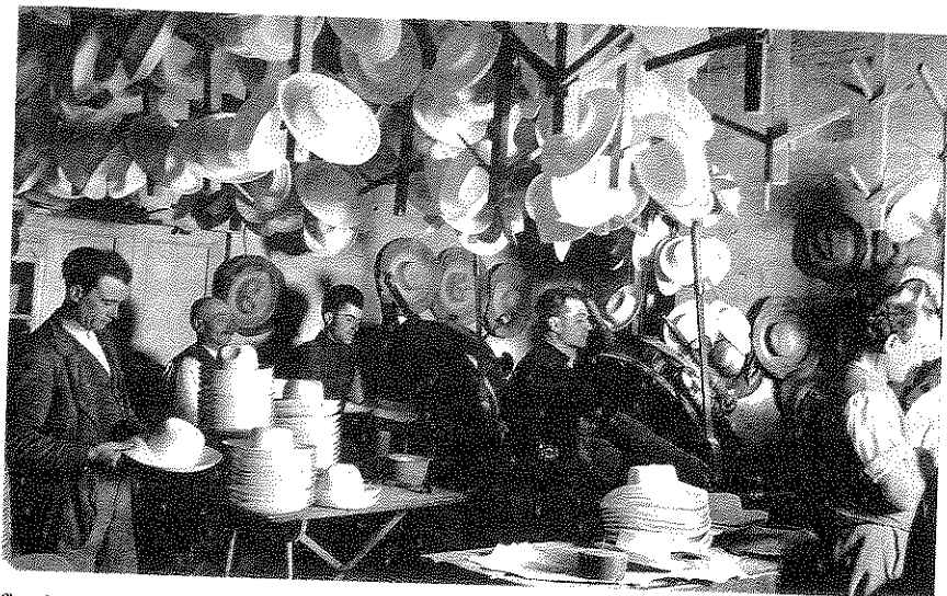
fig. 1 – Montappone. Fabbrica di cappelli. Operai al lavoro (Biblioteca Statale Macerata, foto Balelli n. 1557).

nanzi in vastissima scala verso l'America, «è ridotta a piccole proporzioni verso Corfù, Trieste, Austria e Grecia». Quantità e destinazioni, eccettuato forse il periodo 1900-1920, non si modificheranno di molto fino alla seconda guerra mondiale 56 . Negli anni settanta le uniche macchine in uso erano quella per assortire la paglia e le presse; chi intesseva le trecce alternava questa mansione alla cucitura manuale dei cappelli, i modellatori lavoravano in conto terzi e così pure coloro che vagliavano la paglia. Il grosso della produzione era venduto «a case straniere e nazionali» dai «più facoltosi negozianti» 57 , i quali li acquistavano spesso dai cappel-