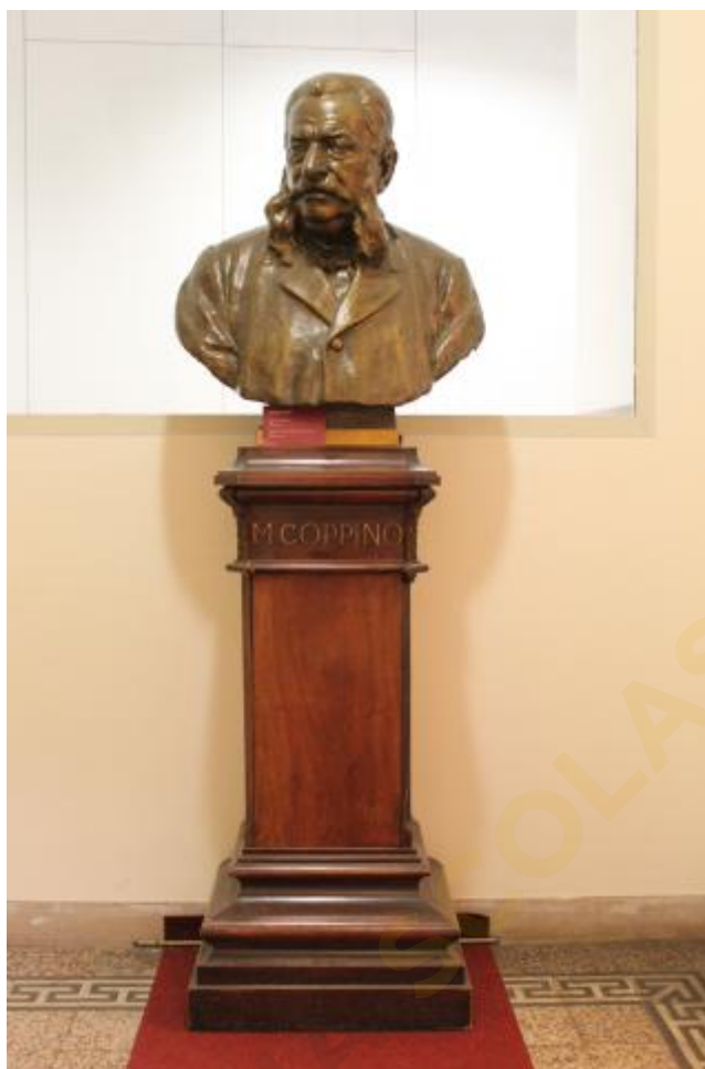
Foto del busto di Michele Coppino, opera di Cesare Reduzzi, ad Alba