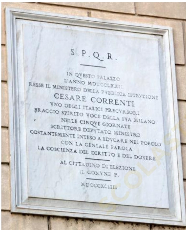
Foto della lapide a Cesare Correnti a Roma