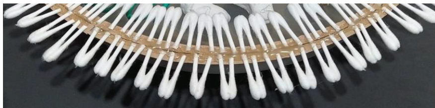
Fig. 8 - Il doppio strato fosfolipidico della membrana cellulare realizzato con dei cotton fioc.

Per la rappresentazione del reticolo endoplasmatico rugoso è stato utilizzato un elastico per capelli, in cui le perline rappresentano i ribosomi ad esso ancorati, mentre per la membrana cellulare sono stati impiegati dei cotton fioc che costituiscono il doppio strato fosfolipidico di cui la membrana cellulare è composta (fig. 8).