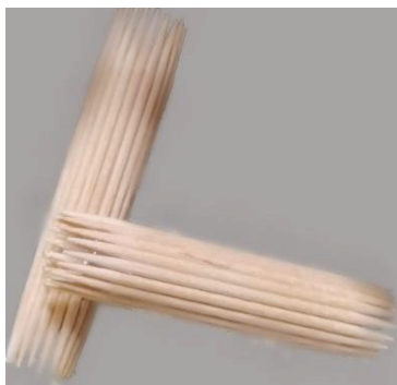
Fig. 9 - I centrioli realizzati con stuzzicadenti.

Per ricreare la struttura cilindrica, gli stuzzicadenti sono stati disposti attorno a delle semplici pile.