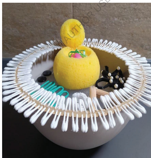
Fig. 2 - La struttura della cellula eucariote, realizzata con un'insalatiera di plastica.