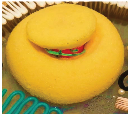
Fig. 3 - Il nucleo della cellula eucariote.

La scelta dei colori dei materiali non è stata casuale: si è preferito, per i diversi componenti del nucleo, dei colori a contrasto tra loro quali giallo, rosa e verde, in modo che le diverse strutture potessero essere discriminate anche dai ragazzi ipovedenti.