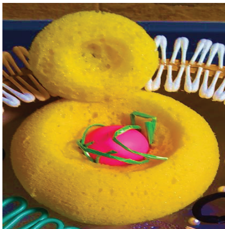
Fig. 4 - Il nucleo della cellula eucariote visto internamente.

Per i mitocondri, organuli di forma tubulare adibiti alla respirazione cellulare, è stato utilizzato il DAS in quanto facilmente modellabile; successivamente si è tracciato su di essi, con uno stecchino, le creste mitocondriali in modo che lo studente, al tatto, sia in grado di percepire la presenza di queste ultime in rilievo (fig. 5).