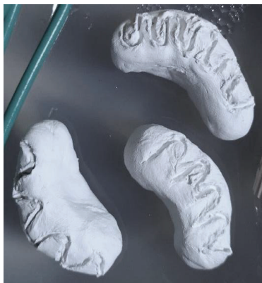
Fig. 5 - Mitocondri realizzati con il DAS.

Per i mitocondri, organuli di forma tubulare adibiti alla respirazione cellulare, è stato utilizzato il DAS in quanto facilmente modellabile; successivamente si è tracciato su di essi, con uno stecchino, le creste mitocondriali in modo che lo studente, al tatto, sia in grado di percepire la presenza di queste ultime in rilievo (fig. 5).