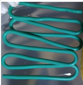
Fig. 7 - L'Apparato del Golgi realizzato con del filo elettrico rigido.

Il filo elettrico rigido è stato invece adoperato per l'Apparato del Golgi, richiamando le vescicole appiattite che costituiscono quest'organulo (fig. 7).