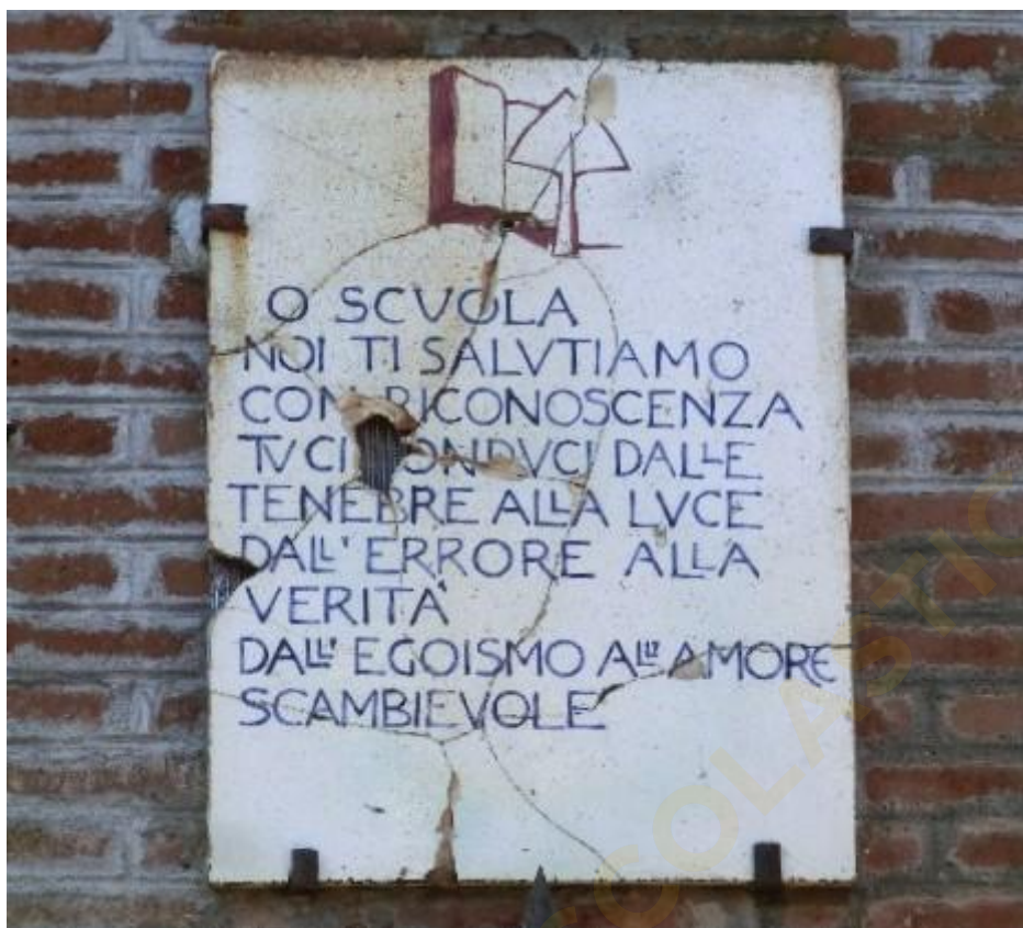
Foto della targa celebrativa della scuola, opera di Duilio Cambellotti, a Colle di Fuori (ritaglio dell'originale)