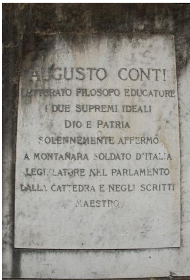
3) Foto di dettaglio dell'epigrafe a fronte