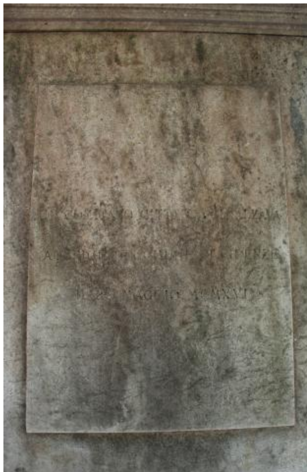
4) Foto di dettaglio dell'epigrafe a tergo