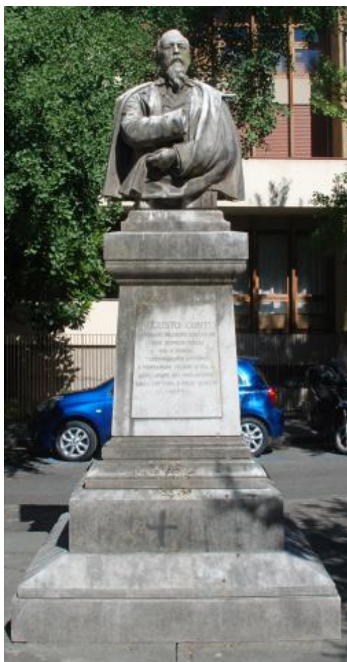
1) Foto del busto con epigrafe ad Augusto Conti a Firenze