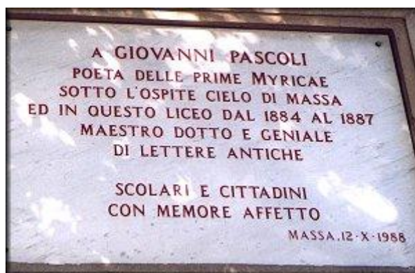
Foto della lapide a Giovanni Pascoli a Massa