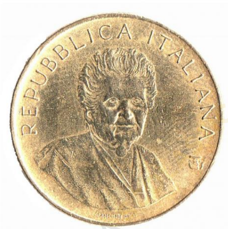
1) Foto del diritto della moneta commemorativa di Maria Montessori (ritaglio dell'originale)