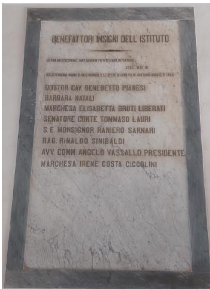
1 - Foto della lapide ai benefattori insigni dell'Istituto salesiano a Macerata