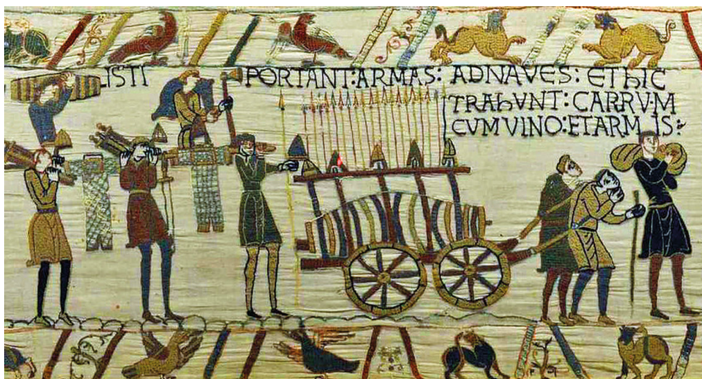
Fig. 1. Bayeux, Musée de la Reine Mathilde, Arazzo di Bayeux , seconda metà dell'XI secolo, particolare