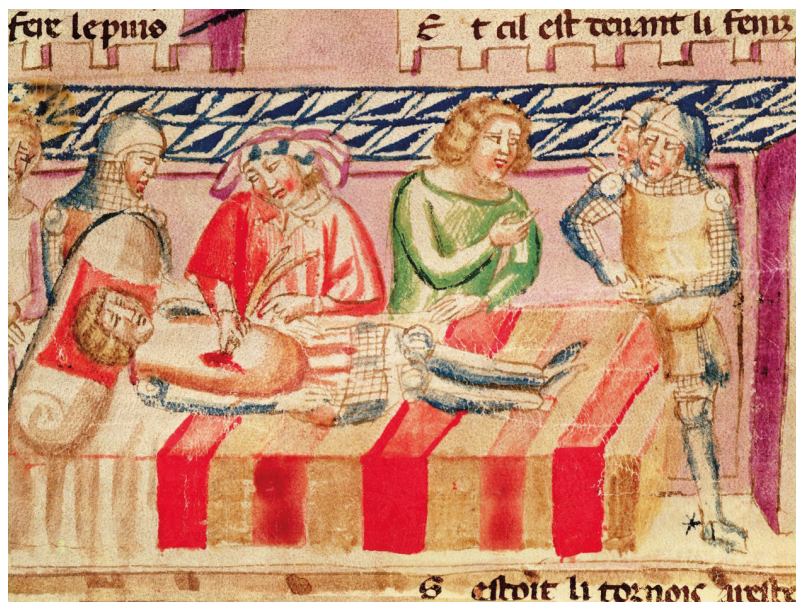
Fig. 4. Intervento chirurgico su un cavaliere ferito. Benoît de Sainte-Maure, Roman de Troie (1330-1340). Venezia, Biblioteca Nazionale Marciana , MS fr. Z 17 (230), c. 123v