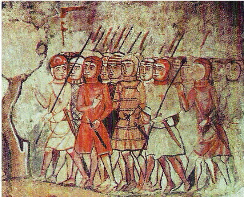
Fig. 3. Gli almogàver al seguito di Giacomo I d' Aragona si preparano alla conquista di Maiorca, seconda metà del XIII secolo. Barcellona, Saló del Tinell