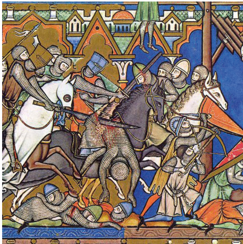
Fig. 7. Cavaliere colpito al ventre. Miniatura dalla Bibbia Maciejowski , metà del XIII secolo. New York, Morgan Library