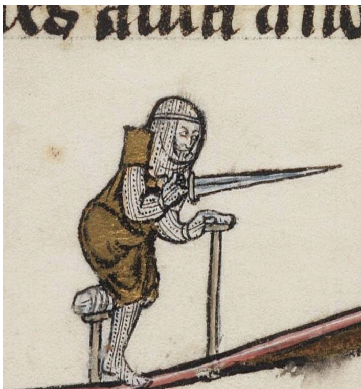
Fig. 2. Cavaliere con una gamba sola. Arthurian Romances , Beinecke MS 229, f. 257v, fine del XIII secolo, Yale University Library , Beinecke Rare Book & Manuscript Library