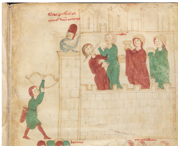
Fig. 6. Ferimento del conte Riccardo di Acerra e rimozione della freccia da parte di un chirurgo. Pietro da Eboli, Liber ad honorem Augusti (1194-1197), f. 110r.