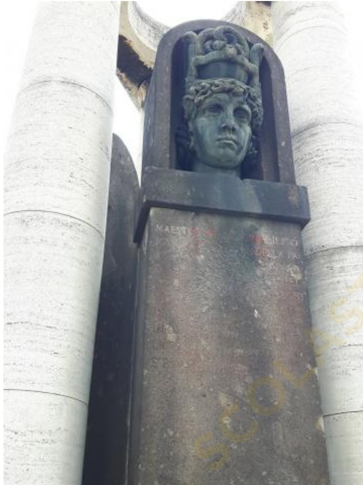
4) Foto della testa femminile allegorica della Medicina (a sinistra del ritratto di Bacelli)