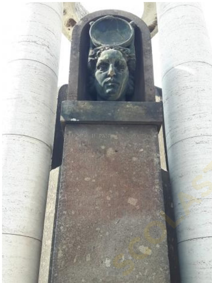
3) Foto della testa femminile allegorica dell'Archeologia (a destra del ritratto di Baccelli)