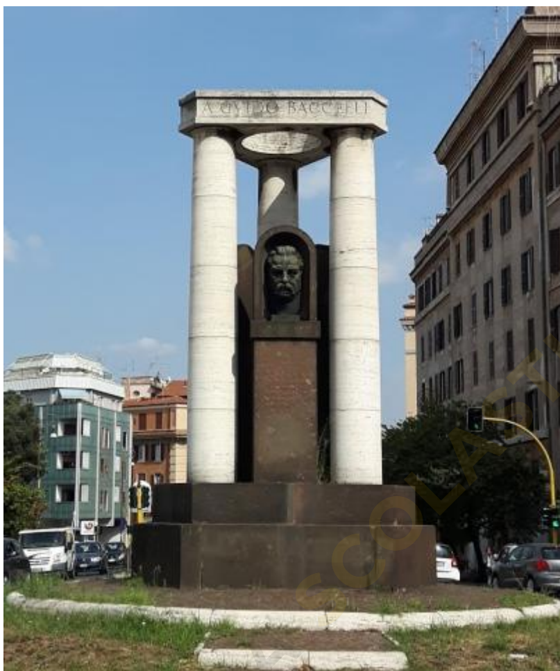
1) Foto del monumento a Guido Baccelli, opera di Attilio Selva, a Roma (ritaglio dell'originale)