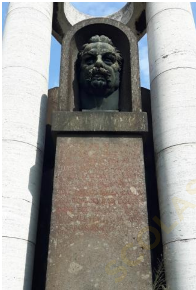
2) Foto della testa di Guido Baccelli (ritaglio dell'originale)