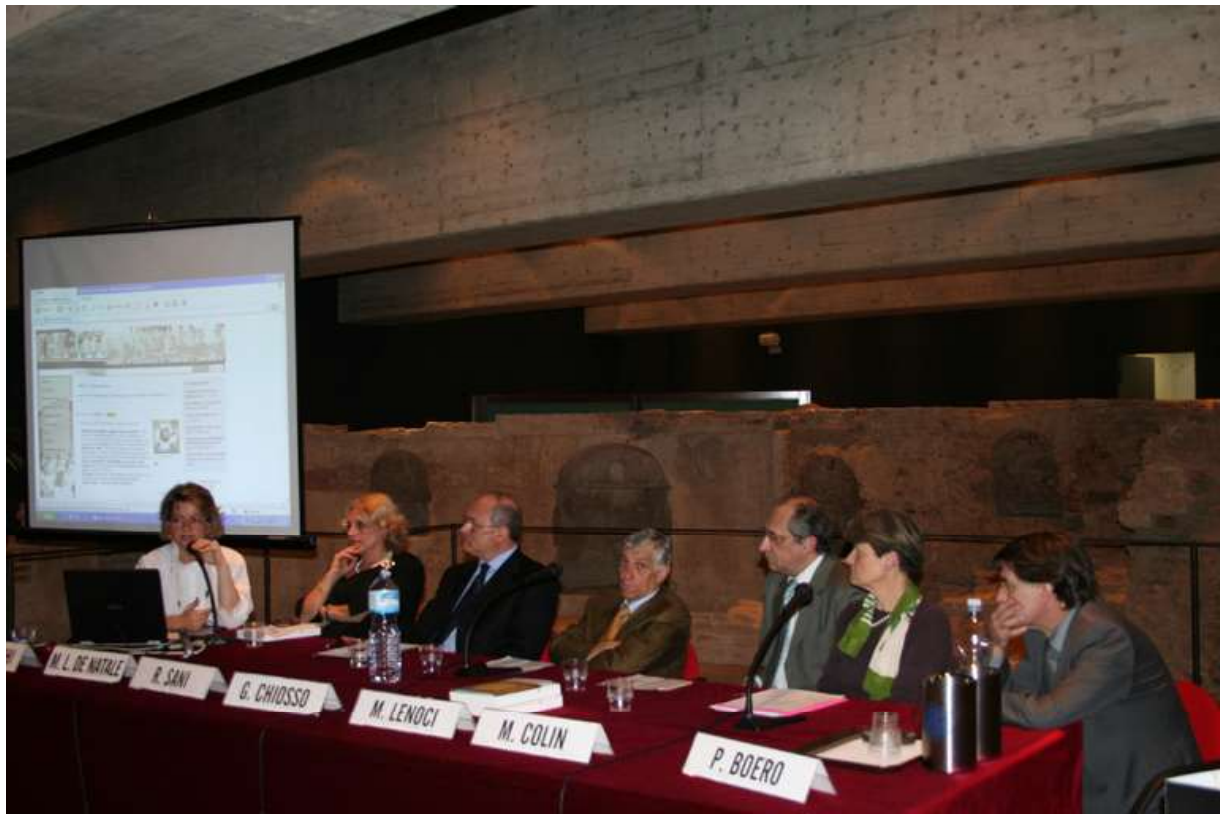
Fig. 3. Seminario del 17 maggio 2007

battito storiografico internazionale. La creazione di HECL, a questo riguardo, testimonia invece proprio l'ambizione del gruppo di storici dell'educazione e della letteratura per l'infanzia italiani che vi collaborano ad esercitare un ruolo di primo piano nel rinnovamento degli studi di settore a livello internazionale e di costituire un punto di riferimento per gli studiosi europei ed extraeuropei della disciplina. In altre parole obiettivo precipuo del gruppo di ricerca gravitante intorno alla rivista era ed è proprio quello di assicurare una presenza e un ruolo autenticamente internazionali alle indagini di storia dell'educazione condotte in Italia, la qual cosa, in tempi di accelerata e ormai sempre più vasta globalizzazione degli studi non solo di settore, ma del più complessivo ambito umanistico, significava garantire, in prospettiva, la possibilità stessa di una ricerca storico-educativa che, sullo scenario internazionale, riflettesse il lavoro e le esperienze dei singoli ricercatori e delle équipes di studiosi della penisola 9 .