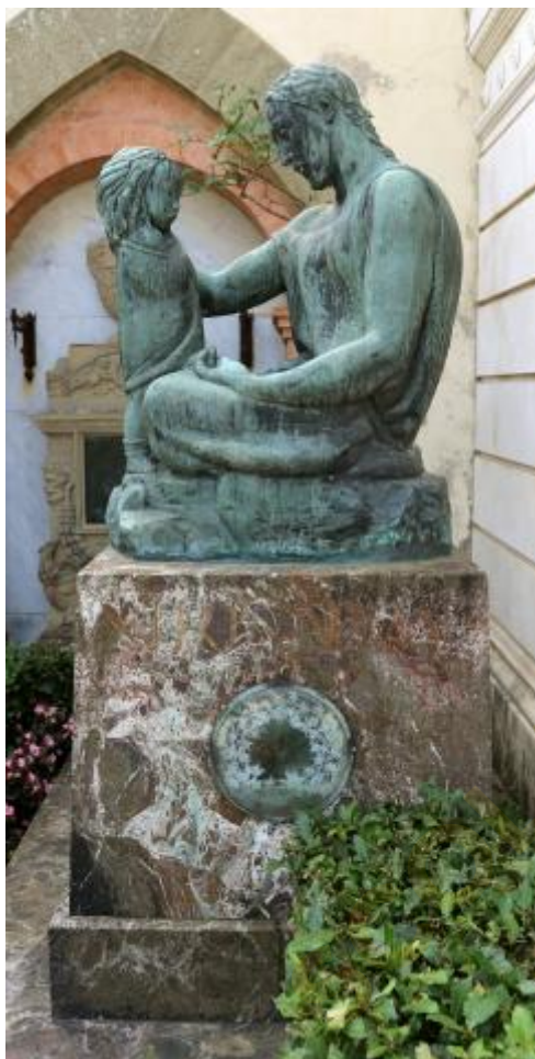
2) Foto del monumento funebre a Luigi Bertelli, opera di Libero Andreotti, a Firenze (vista laterale)