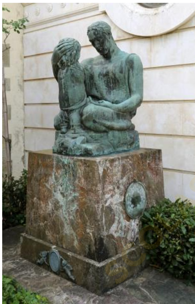
1) Foto del monumento funebre a Luigi Bertelli, opera di Libero Andreotti, a Firenze