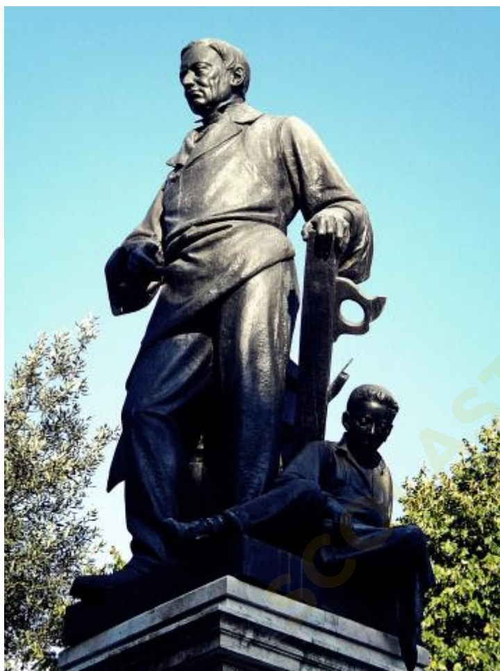
Foto del monumento a Gaetano Magnolfi, opera di Oreste Chilleri, a Prato