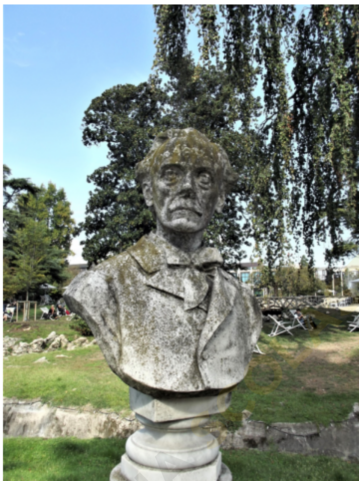
Foto del busto di Aristide Gabelli, opera di Natale Sanavio, a Padova