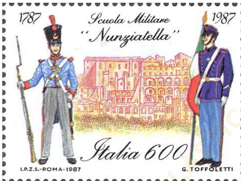
FIG. 1 – Francobollo celebrativo della Scuola Militare Nunziatella nel secondo centenario della sua fondazione