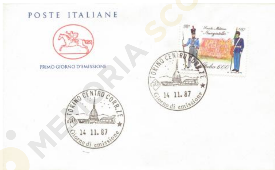
FIG. 2 – Cavallino, emittente Poste italiane, annullo primo giorno Torino centro, non viaggiato. CpB