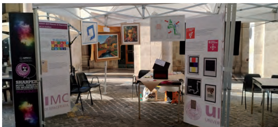
Fig. 2. Allestimento.