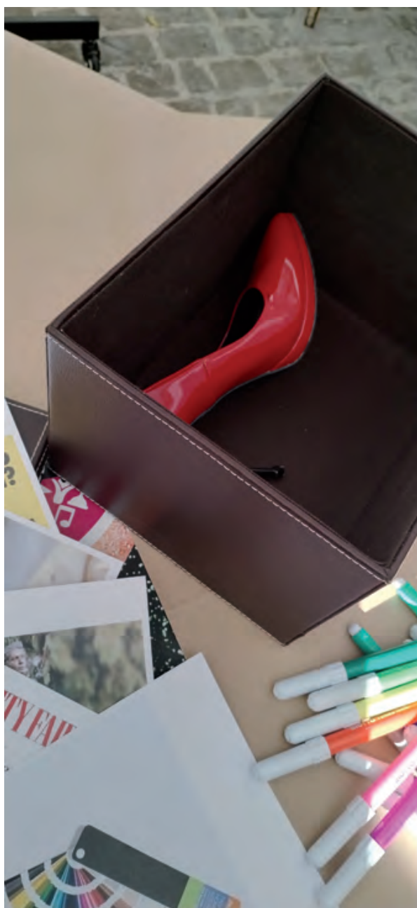
Fig. 4a-b. Particolari dell'al- lestimento.