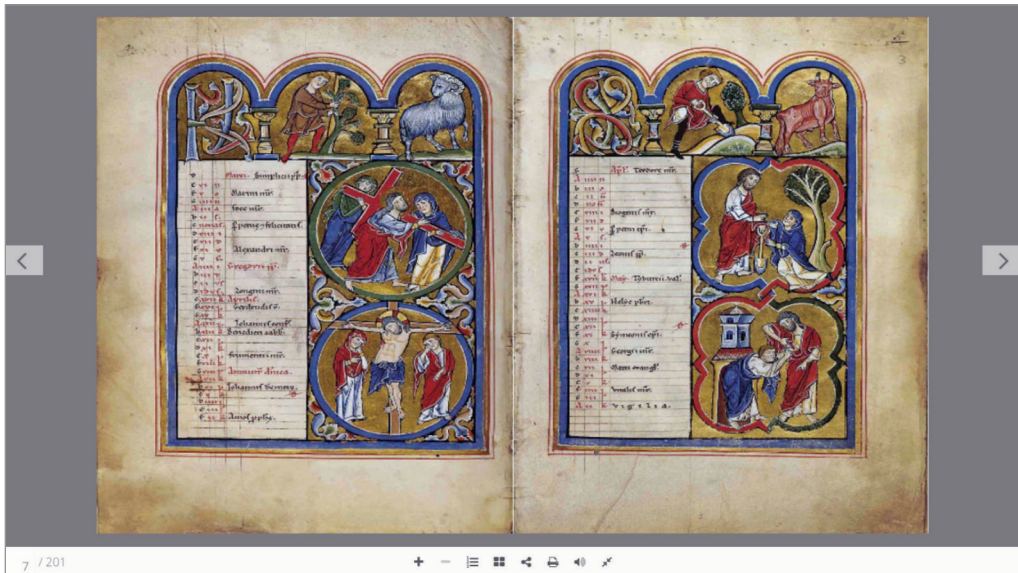
Foto 2: Il Salterio di S. Elisabetta interamente “sfogliabile” on-line.

servano i preziosi tesori resi finalmente accessibili attraverso il portale.