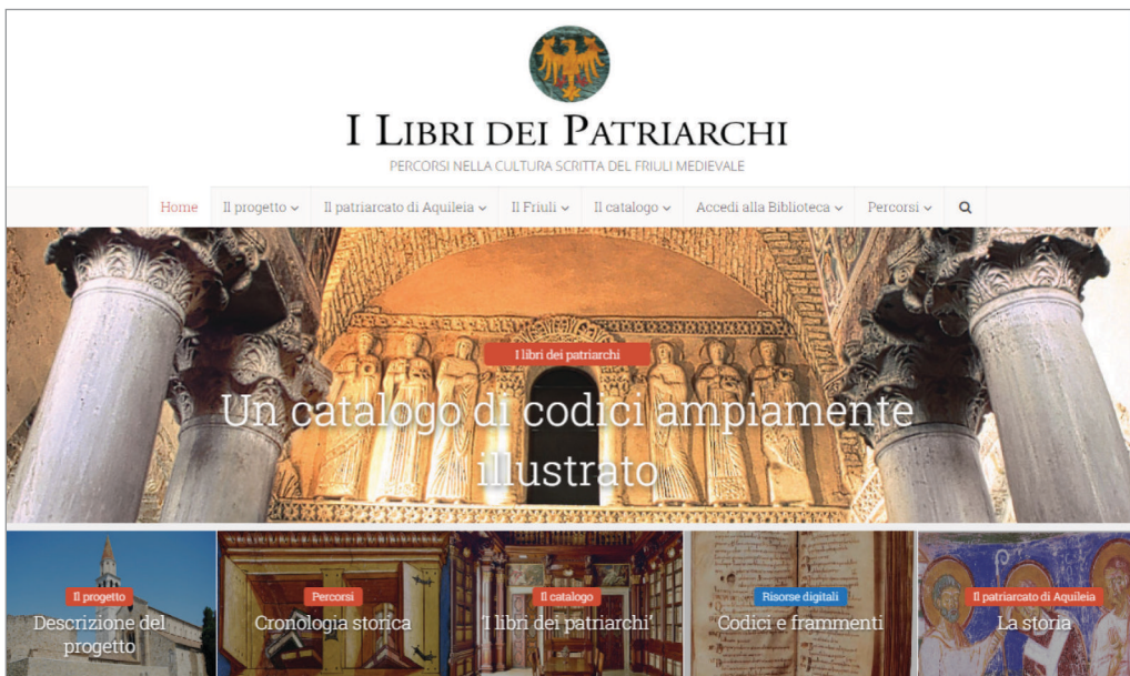
Fig. 1: la home page del portale «I libri dei patriarchi».

La possibilità di far "esplodere" tanta massa documentaria in un percorso che agevoli nell'utente la ricerca e la "navigazione" all'interno delle diverse sezioni che fra loro si intersecano e si compenetrano, e che è già evidente nella veste editoriale cartacea, ha trovato una sua concretizzazione nella realizzazione di un portale web 2 capace di enfatizzare e ampliare e rendere ancor più stimolante l'esplorazione dei documenti messi, finalmente, a disposizione di un pubblico virtualmente senza confini.