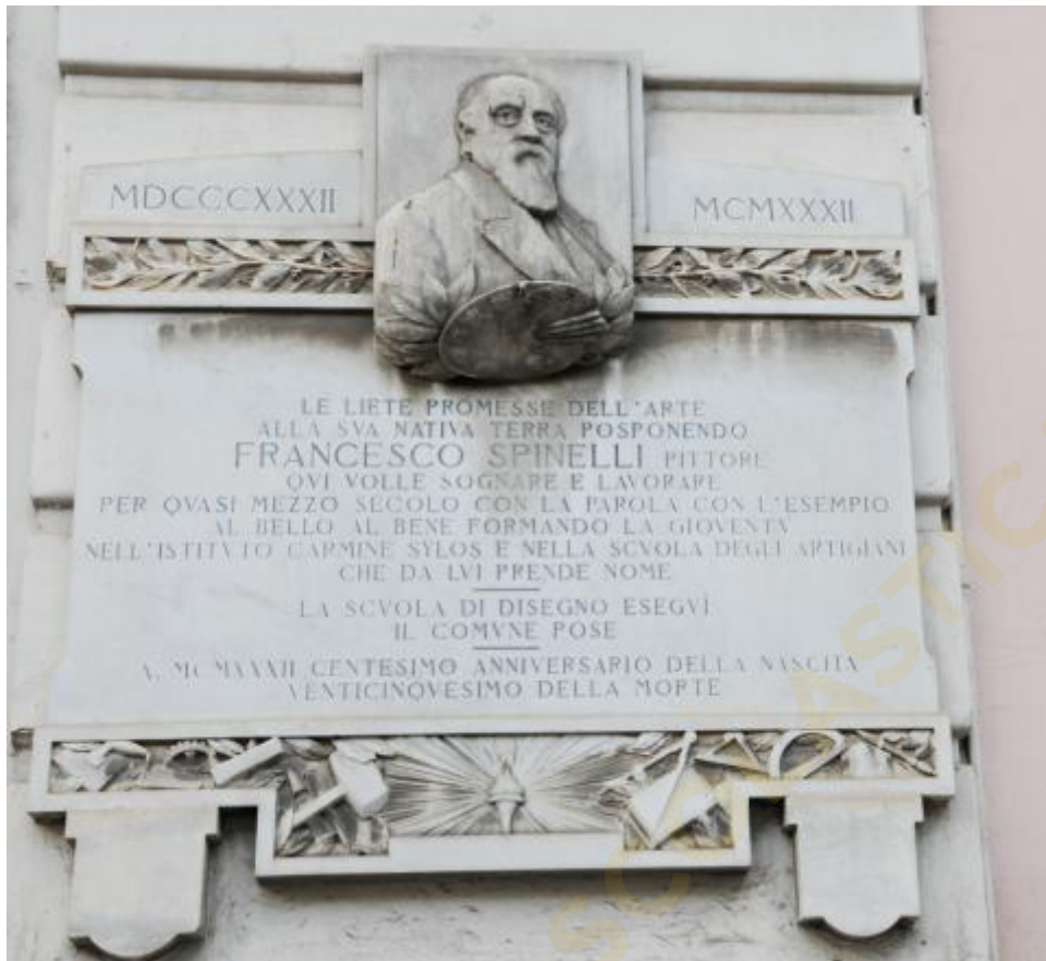
Foto della lapide a Francesco Spinelli a Bitonto