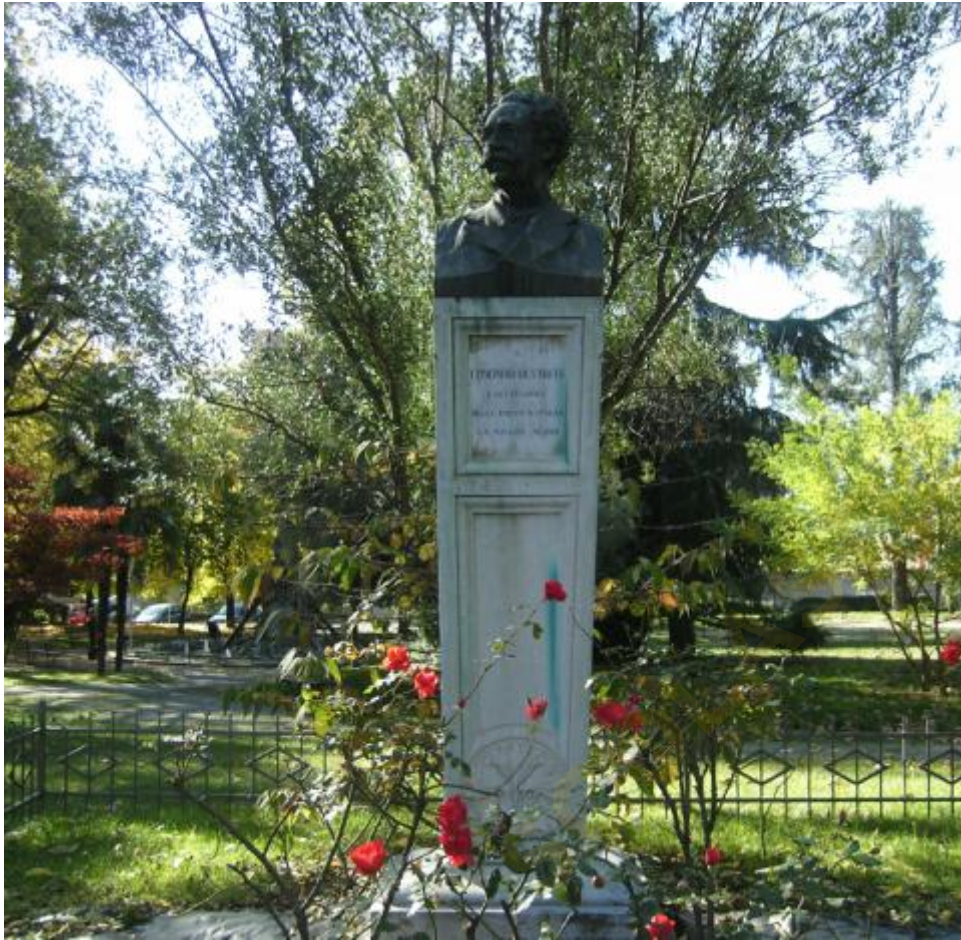
Foto del monumento a Edmondo De Amicis, opera di Pietro Canonica, a Pinerolo