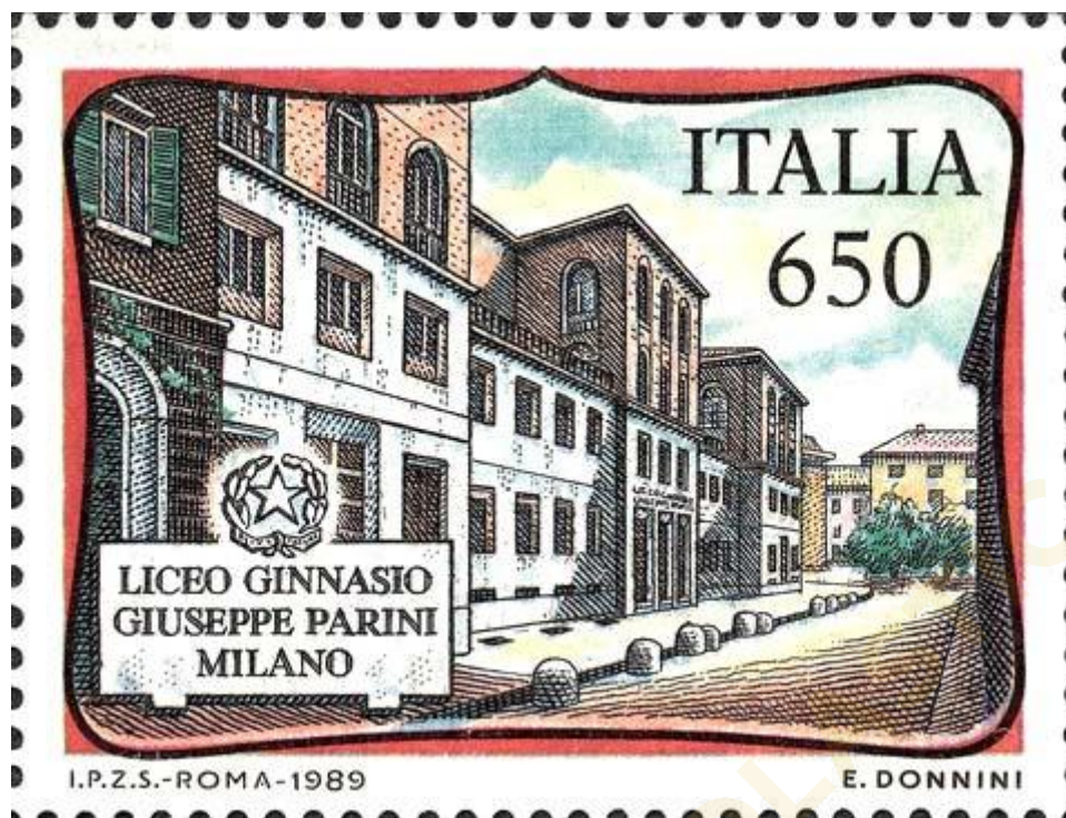
FIG. 1 – Francobollo celebrativo del Liceo Ginnasio Giuseppe Parini di Milano