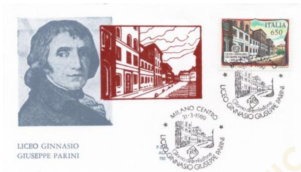
FIG. 3 – First day cover, emittente ALA, annullo filatelico primo giorno Milano centro, non viaggiata. CpB