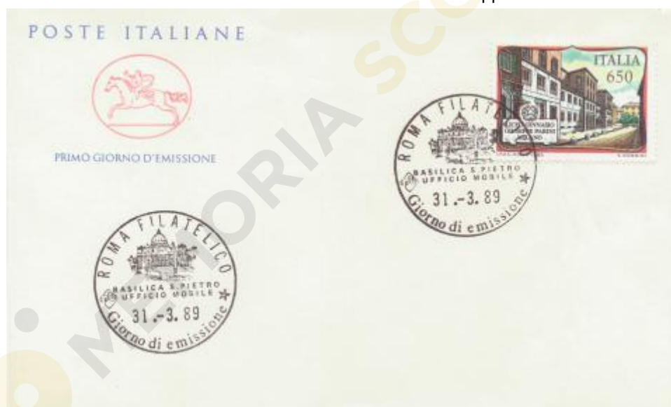
FIG. 2 – Cavallino, emittente Poste italiane, annullo filatelico primo giorno Roma, non viaggiato. CpB