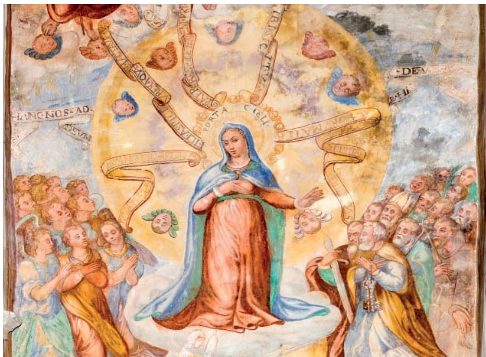
Fig. 11. Doppia intercessione , Mevale di Visso, chiesa di S. Maria Annunziata, particolare