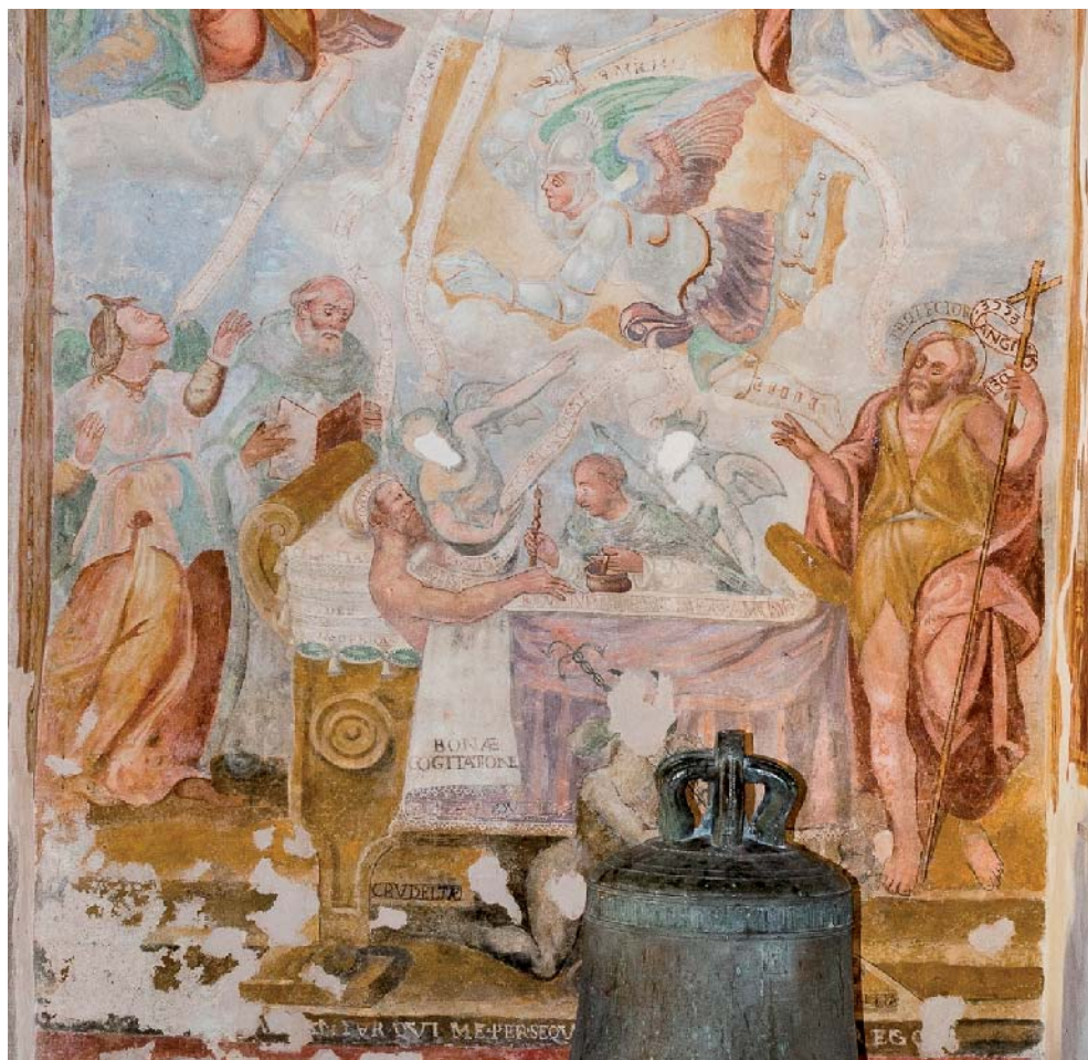
Fig. 13. Doppia intercessione , Mevale di Visso, chiesa di S. Maria Annunziata, particolare