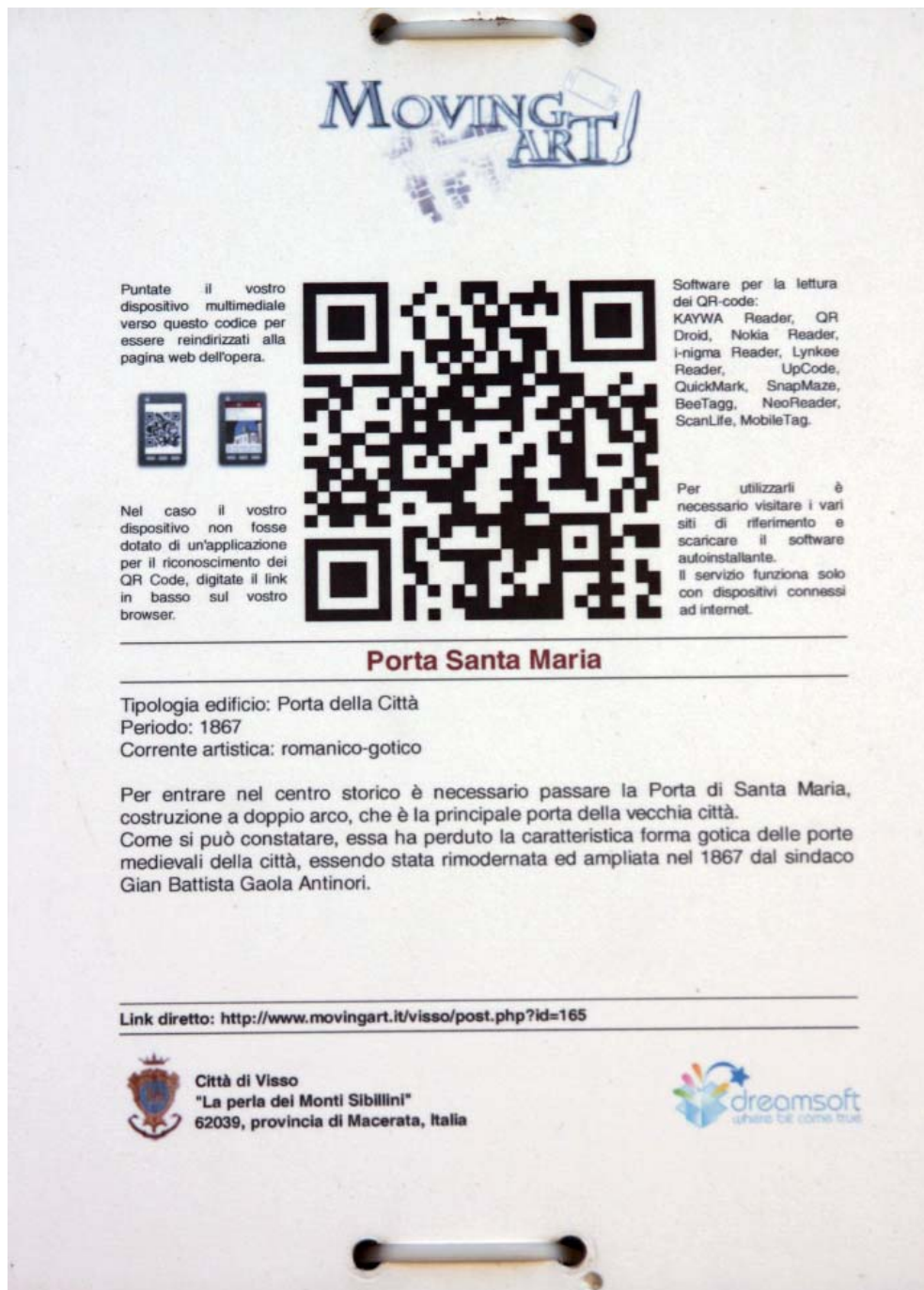
Fig. 4. Esempio di comunicazione con QR-code attiva nel centro storico di Visso