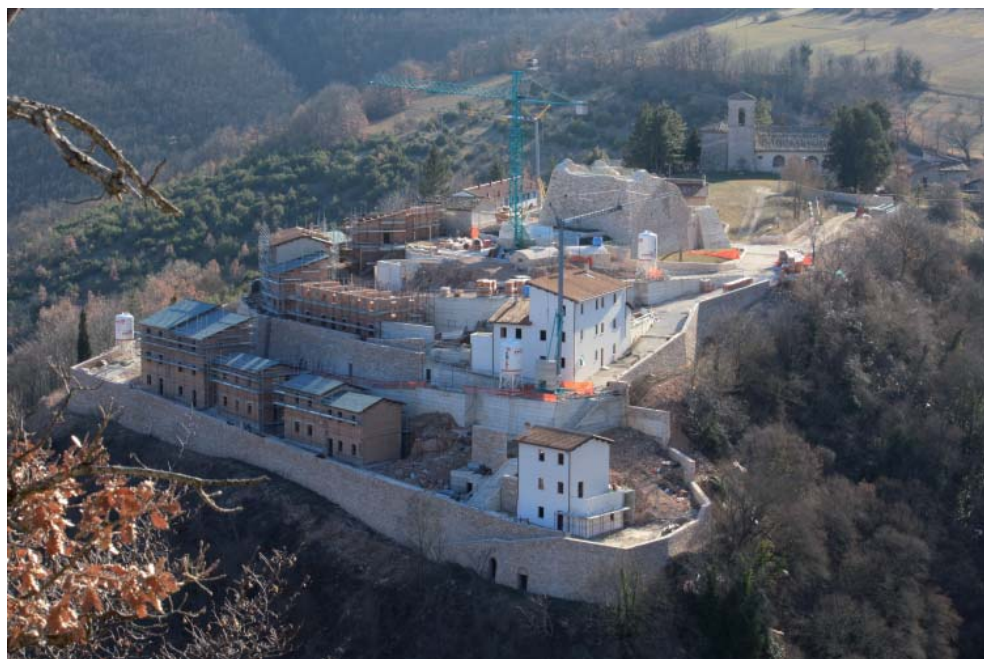
Fig. 3. Mevale di Visso, Ricostruzione del borgo