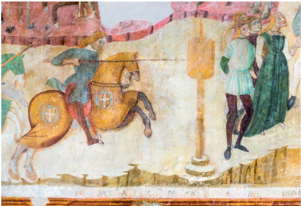
Fig. 8. Miracolo mariano, giostra e danze , Mevale di Visso, chiesa di S. Maria Annunziata, particolare