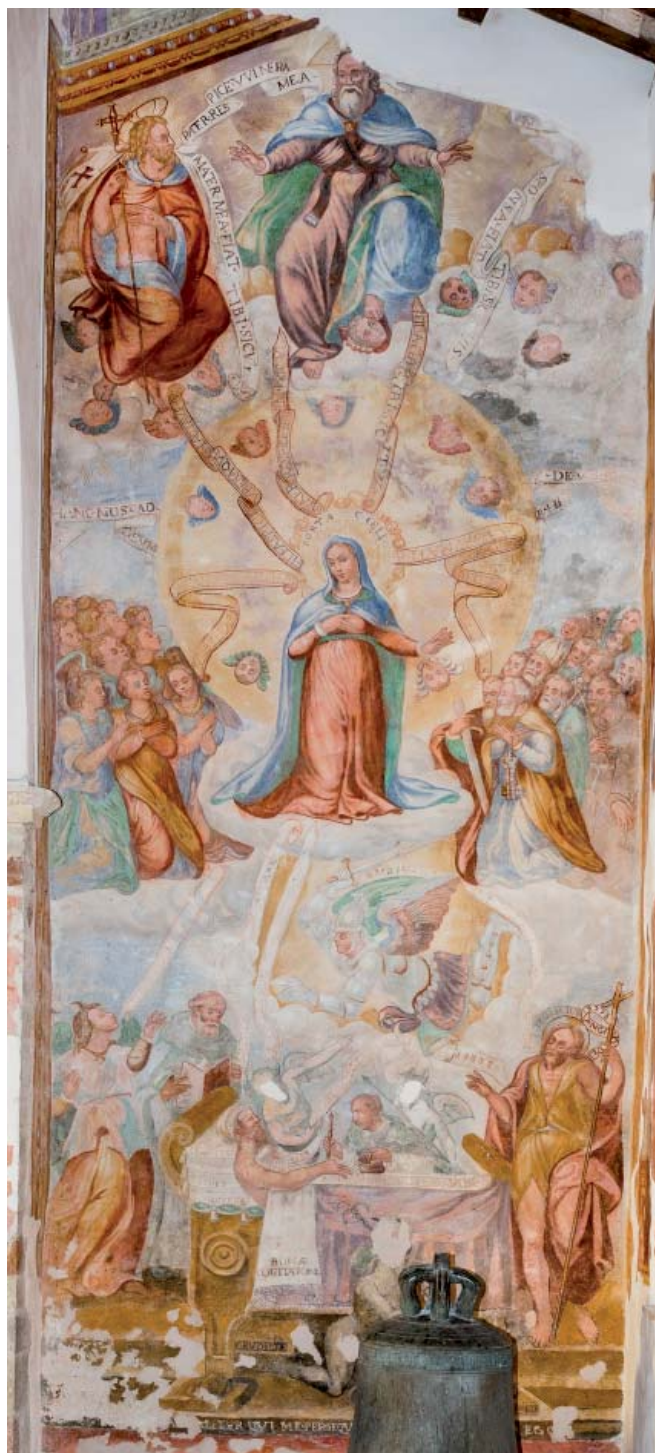
Fig. 10. Doppia intercessione , Mevale di Visso, chiesa di S. Maria Annunziata