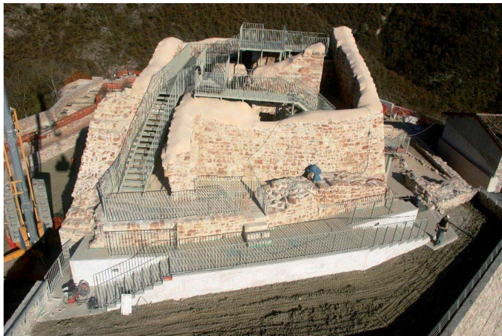
Fig. 2. Il castello di Mevale di Visso, Lavori di consolidamento