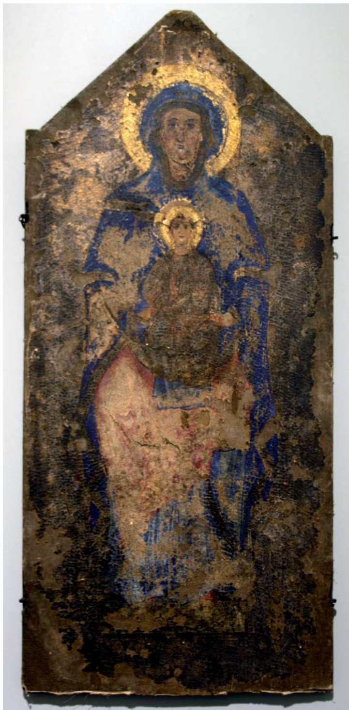
Fig. 5. Tavola della Madonna di Mevale, Visso, Museo