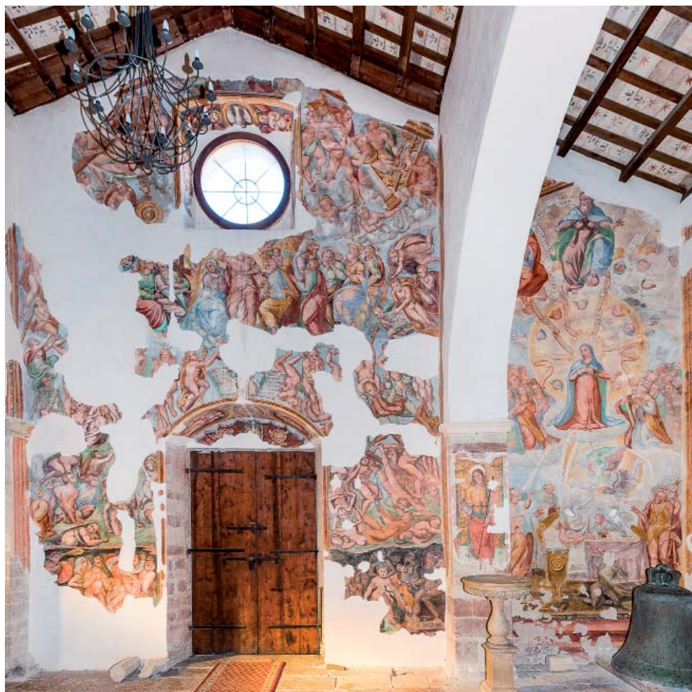
Fig. 14. Doppia intercessione e Giudizio finale , Mevale di Visso, chiesa di S. Maria Annunziata