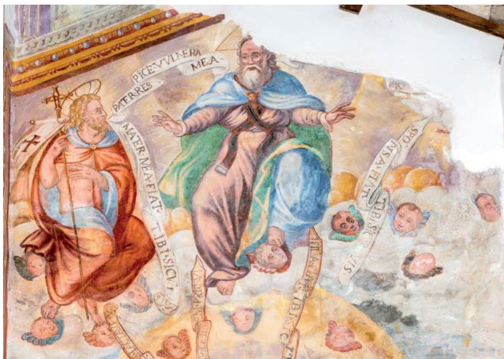
Fig. 12. Doppia intercessione , Mevale di Visso, chiesa di S. Maria Annunziata, particolare