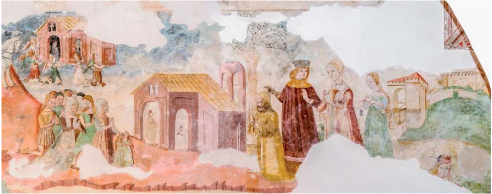
Fig. 7. Miracolo mariano, giostra e danze (particolare), Mevale di Visso, chiesa di S. Maria Annunziata