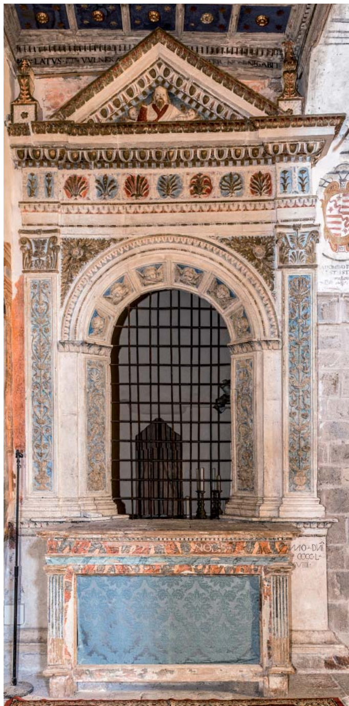
Fig. 9. Sacello della Madonna di Mevale, Mevale di Visso, chiesa di S. Maria Annunziata